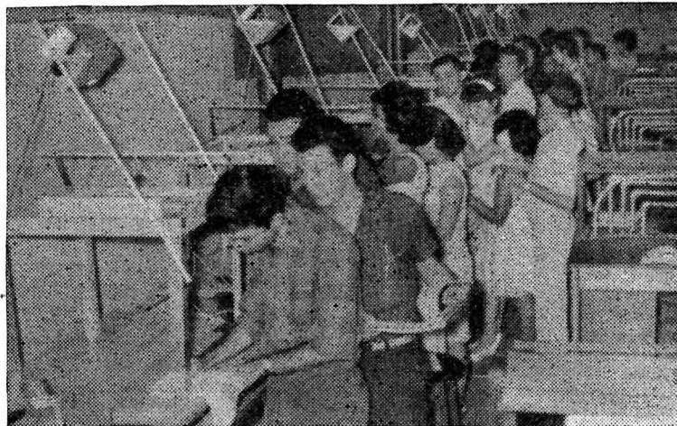
ESTUDIO DE ONDAS. —Un grupo de alumnos del Departamento de Física y Matemáticas estudian un modelo que representa la luz como una onda, con aparatos denominados tanques de ondas. El Departamento de Física y Matemáticas, así como Biología y Química, integrarán a fines de 1966 la Facultad de Ciencias.