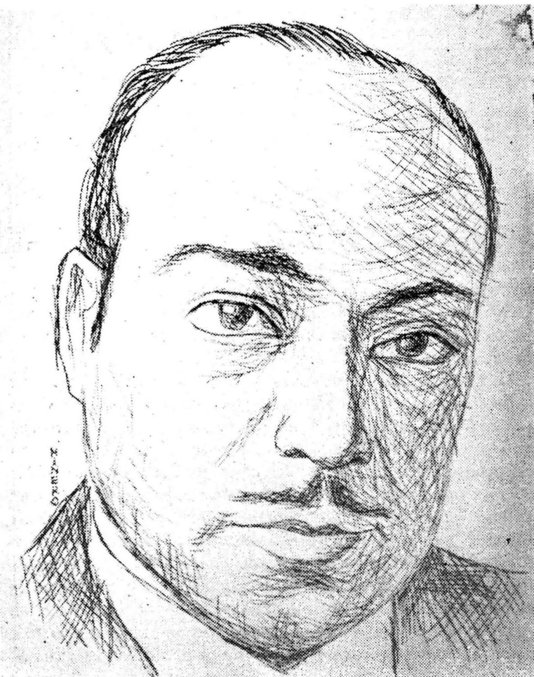
Jorge Carrera Andrade

JORGE CARRERA ANDRADE (Poeta Ecuatoriano)