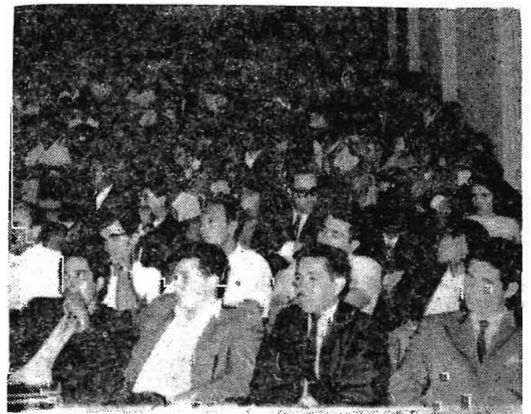
La presencia, de los numerosos estudiantes pertenecientes a distintas Facultades y la compactación de los mismos en torno a las dificultades porque atraviesa la Universidad, son una muestra de que el espíritu combativo de los estudiantes no decae.