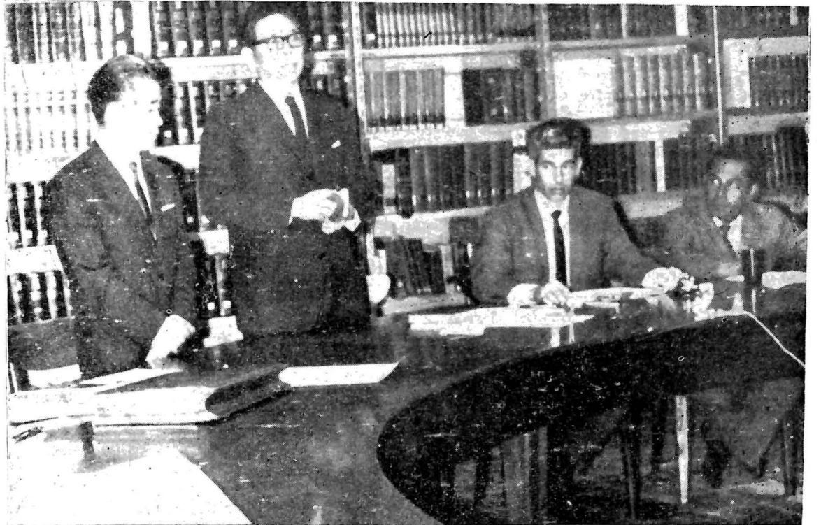
El señor Wan Bok Choi, Rector de la Universidad de Corea para Estudios Extranjeros, en el momento de decir su discurso ante los miembros del Honorable Consejo Superior Universitario, el día en que fue firmado el Convenio de Intercambio Cultural entre la Universidad de Corea y la Universidad de El Salvador.

En esa reunión histórica del Rector coreano con el Honorable Consejo Superior Universitario, se firmó el Convenio aludido, por el cual se establece un vínculo entre nuestro país y el de Corea del Sur.