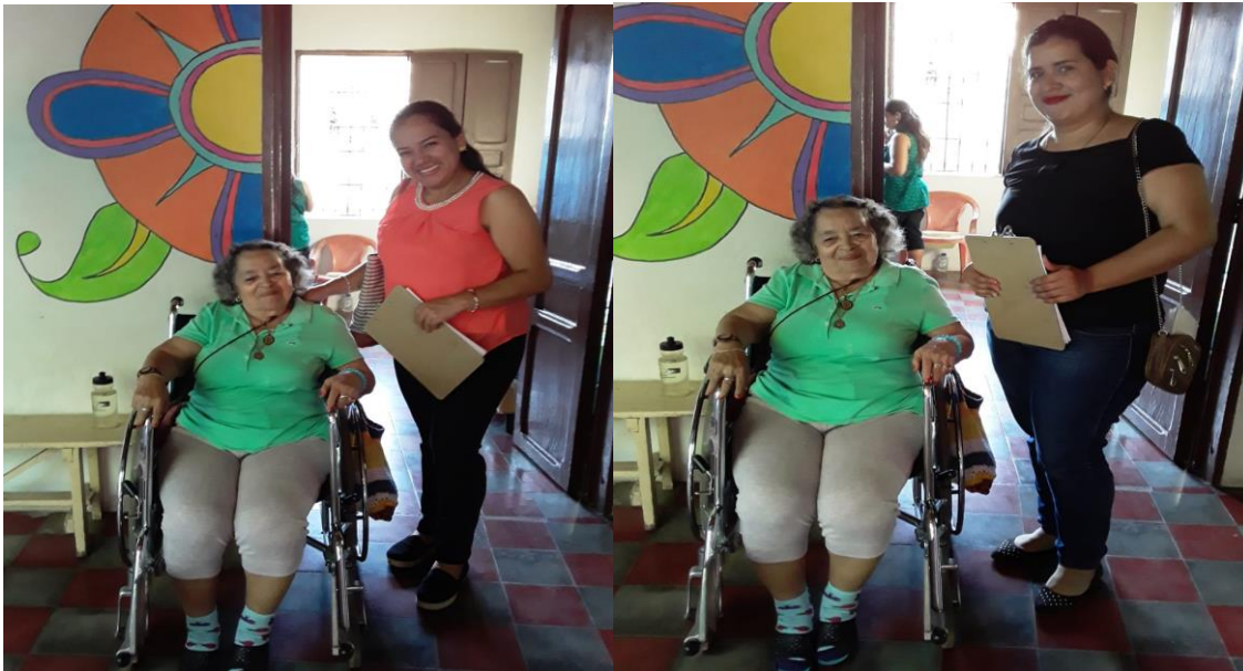
Realización de entrevistas dirigidas a adultas mayores del Hogar de Ancianas San Vicente de Paúl.