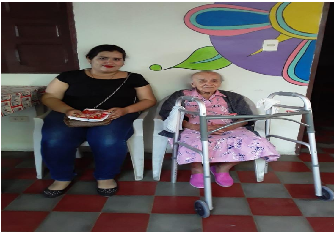
Realización de entrevistas dirigidas a adultas mayores del Hogar de Ancianas San Vicente de Paúl.