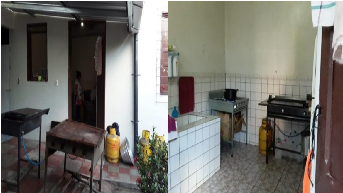
Cocina donde se preparan los alimentos de las adultas mayores del Hogar de Ancianas San Vicente de Paúl.