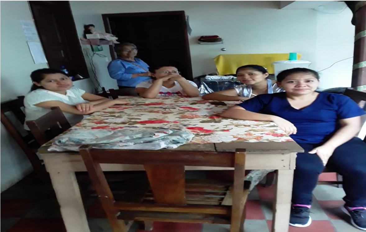
Personal que labora en el Hogar de Ancianas San Vicente de Paúl.