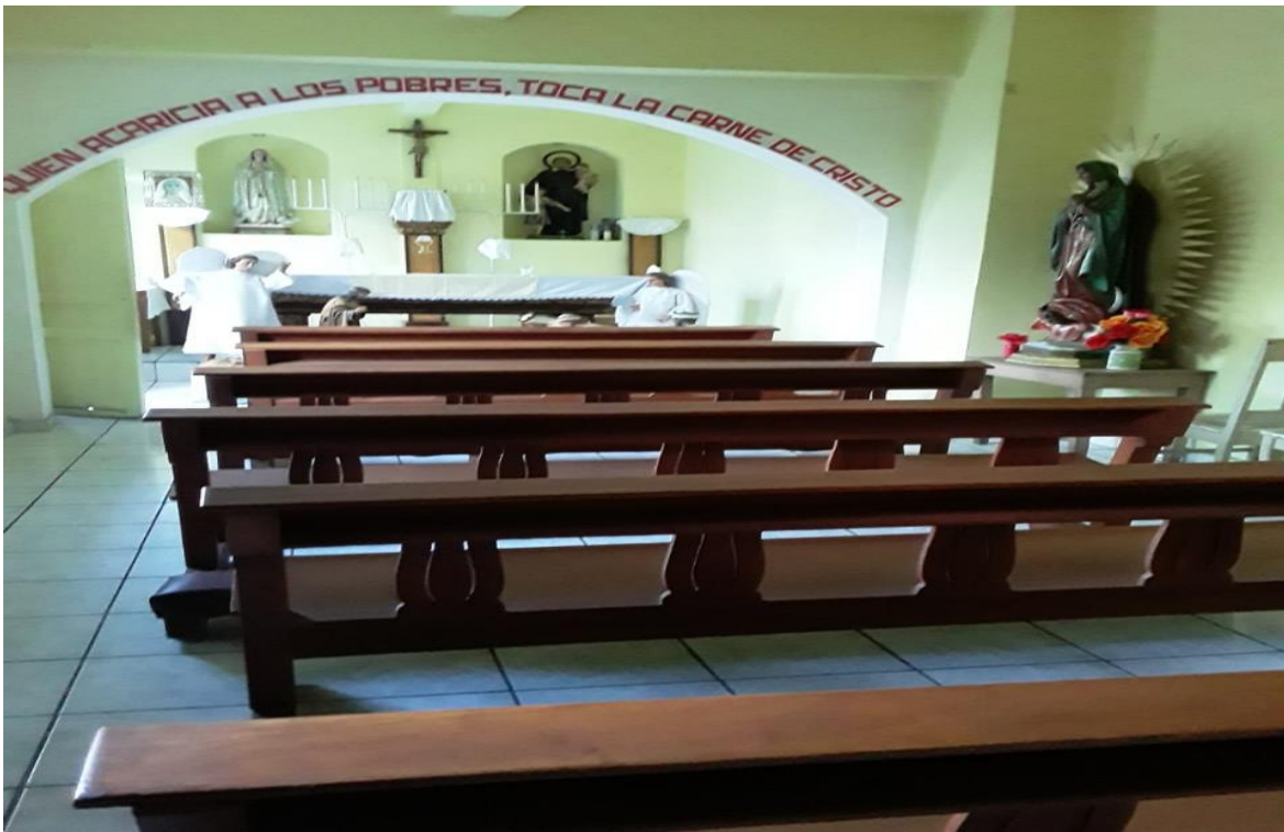
Capilla del Hogar de Ancianas San Vicente de Paúl, donde se realizan diferentes actividades religiosas con las adultas mayores.