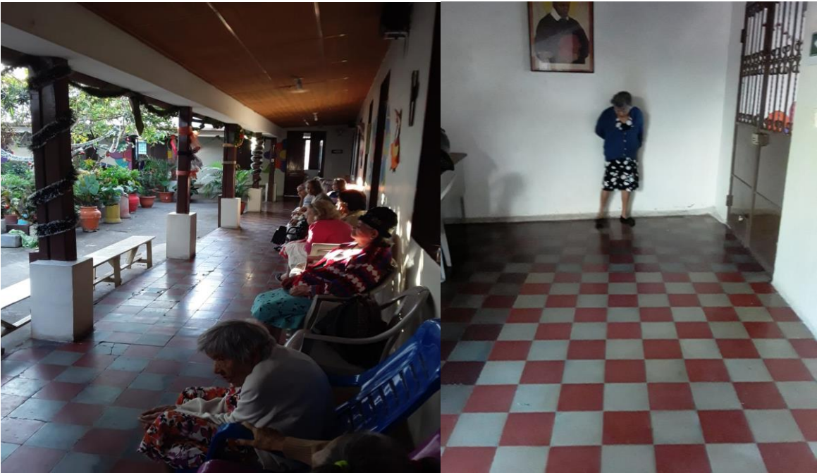
Adultas mayores del Hogar de Ancianas San Vicente de Paúl