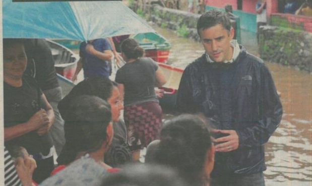
El candidato de la Alianza por un Nuevo País conversa con pobladores del cantón El Borbollón, en El Tránsito, en San Miguel, cuyas viviendas fueron dañadas por las inundaciones en la zona.