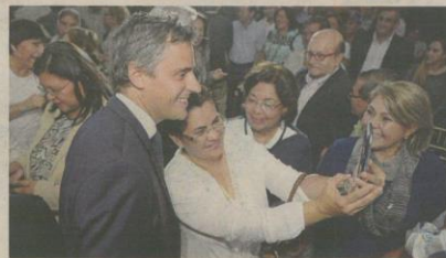
Miembros de la sociedad civil también pudieron compartir con el candidato presidencial en el evento.

Se trata de evitar que las personas, sobre todo los jóvenes migren en búsqueda de nuevas y mejores