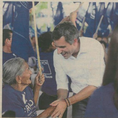
Carlos Calleja saluda a una simpatizante de PCN en San Pedro Perulapán, departamento de Cuscatlán.

La fórmula presidencial explicó que pronto, ahora que el Tribunal Supremo Electoral ha dado el banderillazo de salida para hacer campaña proselitista, comenzarán a presentar propuestas a la ciudadanía, de cara a las presidenciales del 3 de fe-