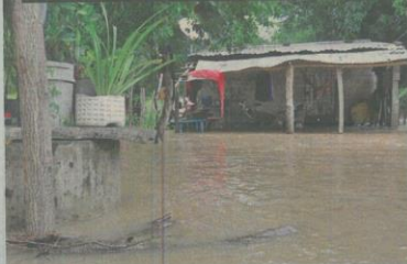
En este cantón resultaron dañadas varias casas ante el desborde de ríos, causado por las tormentas.