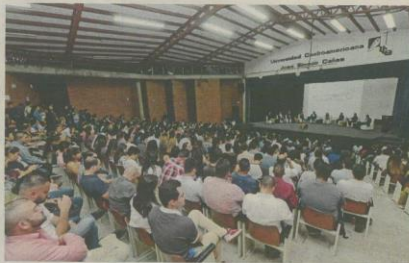
Los candidatos se sometieron a cuestionamientos de reconocidos académicos en cinco ejes temáticos.

Asimismo, la candidata a la vicepresidencia lamentó que en el pasado, particularmente en gobiernos de ARENA, se haya apostado por los mercados y el "rebalse", mas no en las políticas sociales. "El modelo tenía varios elementos en su arquitectura, pero uno que se dejó de lado era que hubiera personas capacitadas, sa-