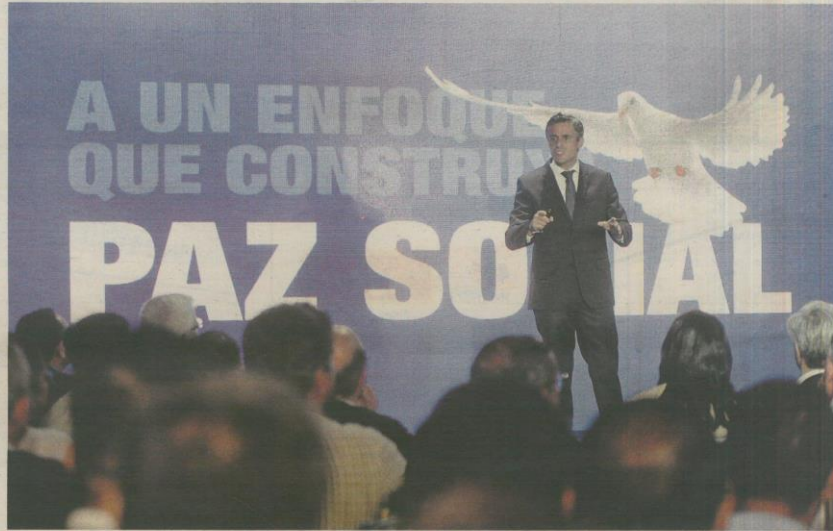
El eje de seguridad se sustituirá por un enfoque de persecución del delito que contribuya a construir Paz Social.

"Vamos a apoyar a la PNC, a la Fiscalía y al Sistema Judicial, cuando hablo con policías, con fiscales, con jueces, se desahogan y el principal adversario para ellos no es la delincuencia, es la falta de recursos, de apoyo y de herramientas para po-