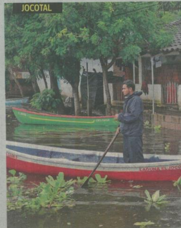
El nivel del agua de la laguna se elevó, debido a las intensas lluvias y llegó hasta las casas de los pobladores.