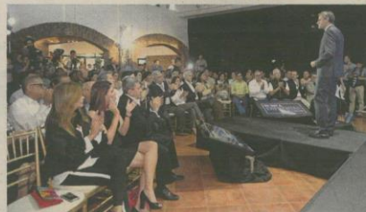
La redefinición de prevención será hacer sostenible y efectivo el Plan de Seguridad Ciudadana, con ayuda de las municipalidades.

der hacer su trabajo", aseveró el candidato.