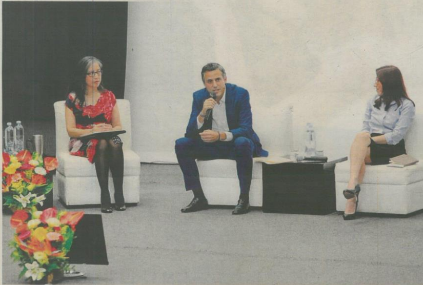
Carlos Calleja y Carmen Aída Lazo, fórmula presidencial de la Alianza por un Nuevo País, participaron ayer en un foro en la UCA.

● En un conversatorio con académicos de la UCA, Carlos Calleja y Carmen Aída Lazo, de la Alianza por un Nuevo País, expusieron sus tres prioridades: unificar al país, fomentar la meritocracia y apostar a igualdad de oportunidades.