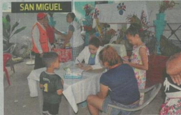
Personal médico atiende a niños y adultos en un albergue improvisado en el cantón El Brazo.