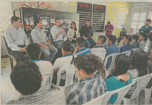
El candidato a presidente de la Alianza por un Nuevo País, Carlos Calleja y la candidata a vicepresidente se reunieron con jóvenes de la Academia de Tecnología Kodigo.

Uno de los estudiantes le preguntó a Calleja que si no hay seguridad en el país, tener estudios y un buen empleo no sirve de mucho, a lo que Calleja le contestó que su visión no es echar "plomo contra plomo", sino prevenir invirtiendo en educación de calidad y en empleos bien remunerados para que los jóvenes no delinquen.