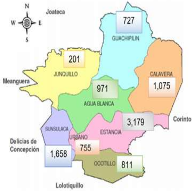
Mapa 3: Distribución de la población Kakawira en el municipio de Cacaopera