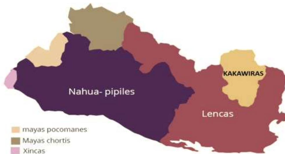
Mapa 2: La ubicación de los principales pueblos indígenas en EL Salvador