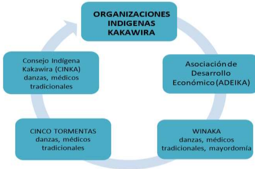
Figura número 2: Entidades que conforman la organización indígena Kakawira

A su vez, existe el Consejo Coordinador, cuya articulación se presenta en la figura número 3.