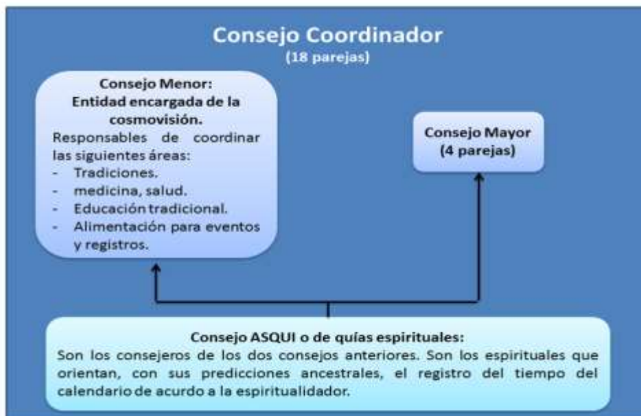
Figura 3: Estructuración del Consejo Coordinador Indígena Kakawira