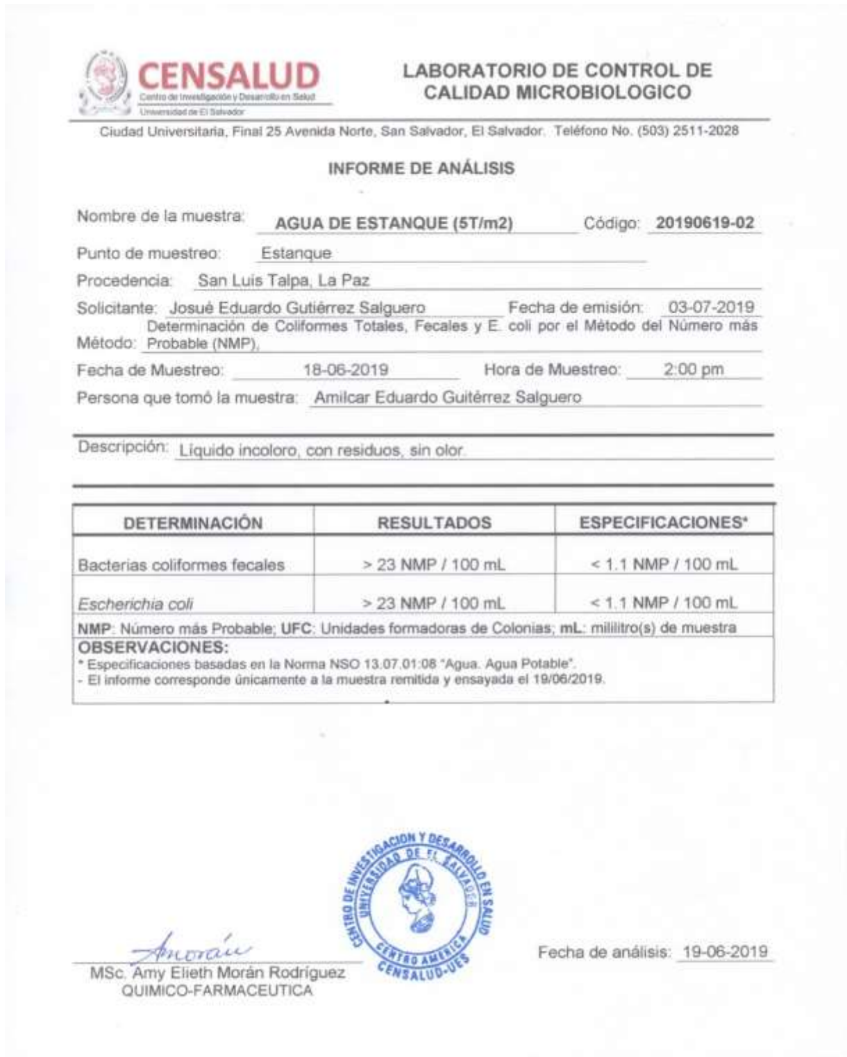
Figura A-2. Resultados de los análisis microbiológicos del agua al final del ciclo productivo en el testigo o tratamiento 0.