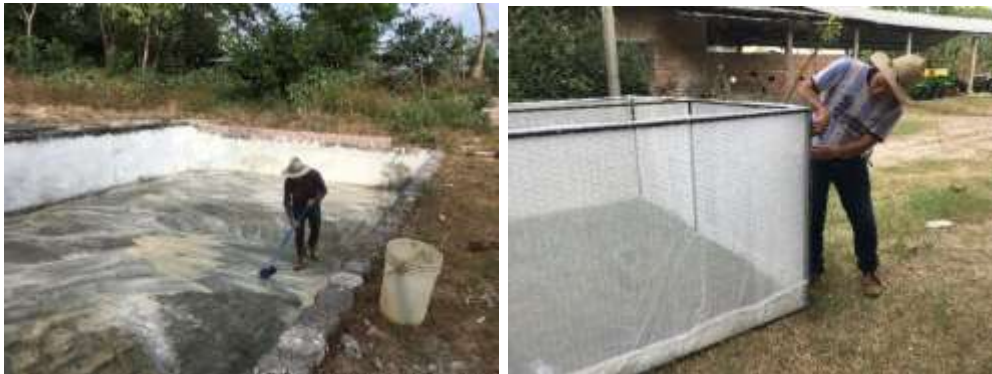
Figura 1. Limpieza del estanque y construcción de las jaulas.

El estanque fue desinfectado con 2.3 kilogramos de cal viva diluida en agua, con una escoba se removió el sedimento y el material acumulado en las paredes y en el fondo. El estanque se dejó expuesto al sol por una semana y luego se procedió al llenado con agua. Se construyeron las jaulas con tubo estructural de hierro de \frac{3}{4} de pulgada, chapa 16 milímetros, se colocó una malla tipo gallinero con un tamaño de los orificios de una pulgada, y para evitar la salida y entrada en los primeros estadios de la tilapia se utilizó una malla de color blanco tipo cedazo. Las medidas de las jaulas fueron de 3 m de largo, 2.5 m de ancho y 1.15 m de altura, con una compuerta ubicada en la parte superior de cada jaula para el manejo de las tilapias (figura 1).