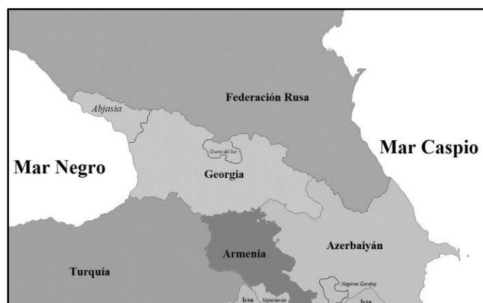
Mapa 2 División política de Transcaucasia

Una lógica de conflictos por razones históricas, territoriales y políticas es la que se ha mantenido a lo largo del tiempo en la zona considerada parte del Heartland o la «región cardinal», a la que se denomina como Cáucaso, Cáucaso meridional o simplemente «Transcaucasia». Como tal, esta zona es una región que comprende a los Estados de Georgia, Armenia, Azerbaiyán, así como un pequeño grupo de Estados de facto que cuentan con reconocimiento parcial por parte de la comunidad internacional, estos son Abjasia, Osetia del Sur, el Nagorno Karabaj y la región autónoma de Najiecheván —perteneciente a Azerbaiyán—.