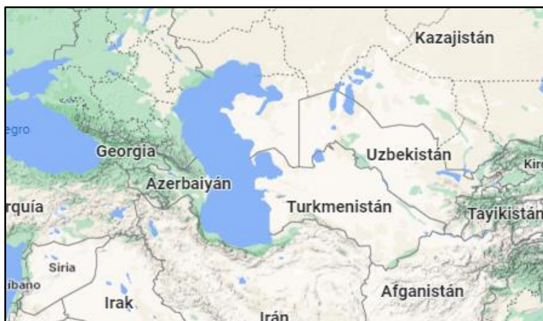
Mapa 1 Ubicación geográfica y relieve del mar Caspio