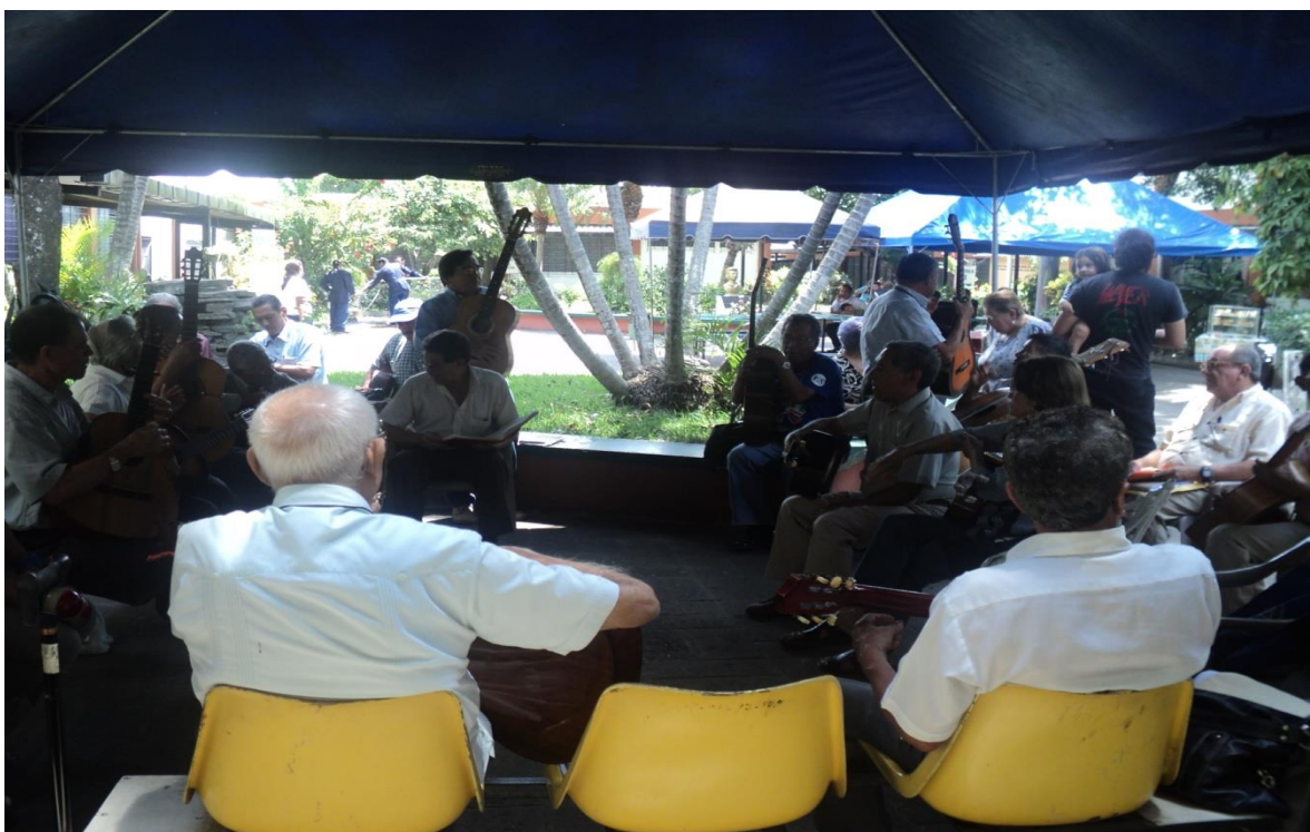
Fuente: Fotografía tomada por Julieta Quijada, en INPEP, Febrero 2012.