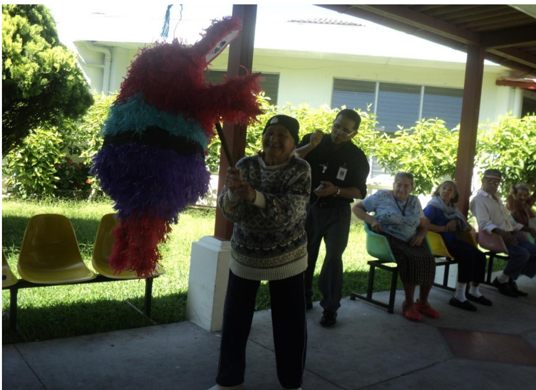
Fuente: Fotografía tomada por Julieta Quijada, en Ciudadela Díaz Sol, Marzo 2012