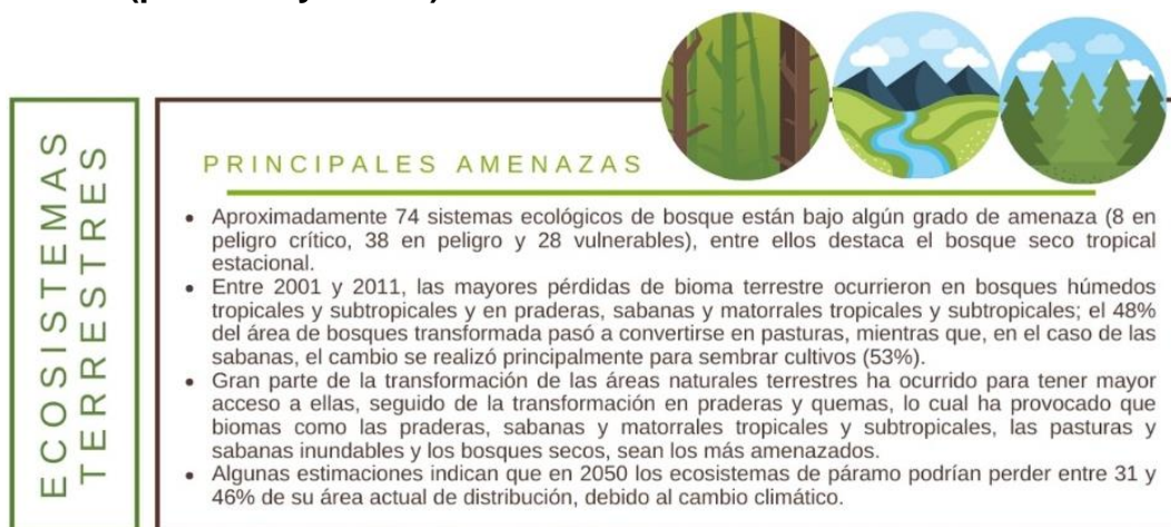
FIGURA 2: Estado de los ecosistemas naturales en América Latina y El Caribe (presente y futuro).

(2019), recoge datos, cifras, estimaciones y conclusiones provenientes de diversos estudios realizados por expertos independientes y organismos como, la misma FAO, PNUMA, Grupo Intergubernamental de Expertos sobre el Cambio Climático (IPCC), entre otros; así como, de instituciones financieras como Banco Mundial y el Banco Interamericano de Desarrollo (BID), ofreciendo un gran y valioso aporte sobre el estado de los ecosistemas y recursos naturales como agua, suelo y bosque. En dicha publicación, se destacan las situaciones de amenaza a los ecosistemas acuáticos y terrestres en la región de ALC. En la FIGURA 2, pueden corroborarse los datos que aseguran que tanto los diversos biomas terrestres como humedales, ecosistemas marinos y de agua dulce, se encuentran en un nivel considerable de degradación, cuyo pronóstico es aún más intimidante y desalentador que su estado actual.