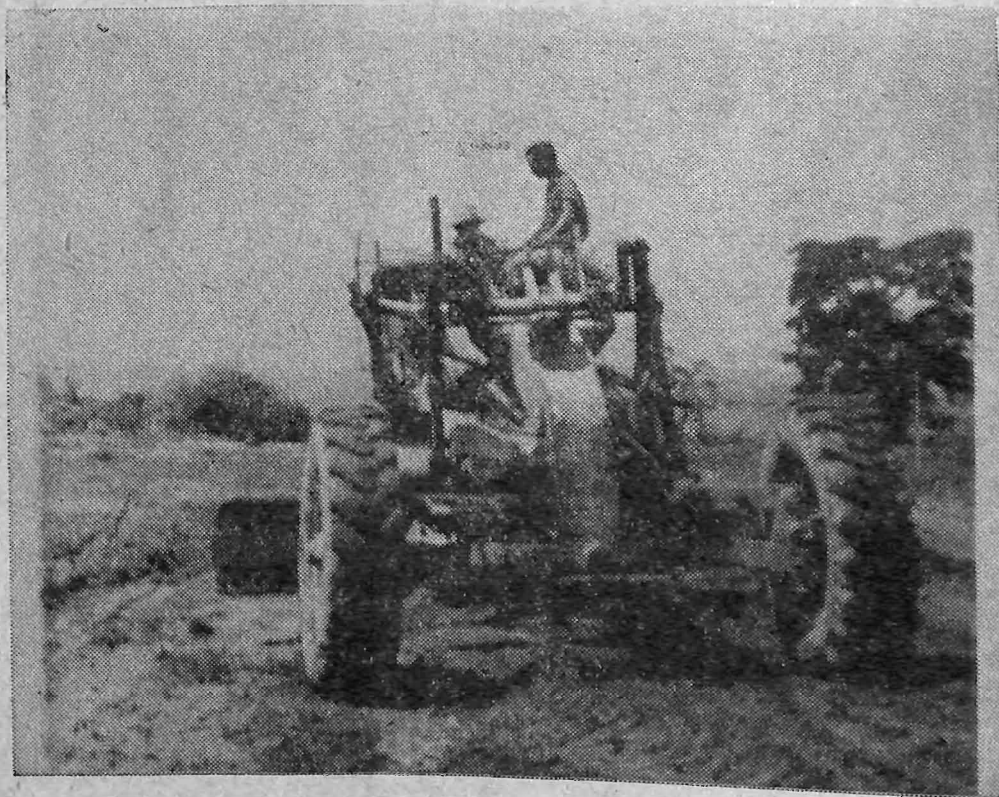
AVANZAN TRABAJOS. —Con la colaboración que ha prestado la Dirección General de Urbanismo y Arquitectura, DUA, facilitando un tractor, los trabajos de terracería que se efectúan en los terrenos de la Ciudad Universitaria, se encuentran bien avanzados. Dentro de poco se anunciará la segunda etapa de los trabajos que se llevan a cabo y que han de permitir embellecer la Ciudad Universitaria y ampliar numerosas construcciones.