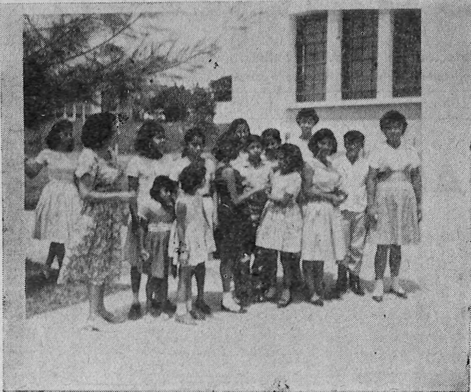
SE INSCRIBEN COMO VOLUNTARIOS.—Alumnos de la Escuela de Sordomudos se inscribieron como trabajadores voluntarios para ayudar en las obras de terracería de la Ciudad Universitaria. Estudiantes de secundaria y otros ciudadanos regalan horas de trabajo en la tarea que se lleva a cabo. En breve se iniciará la segunda etapa del plan y que consiste en la construcción de una serie de edificios.