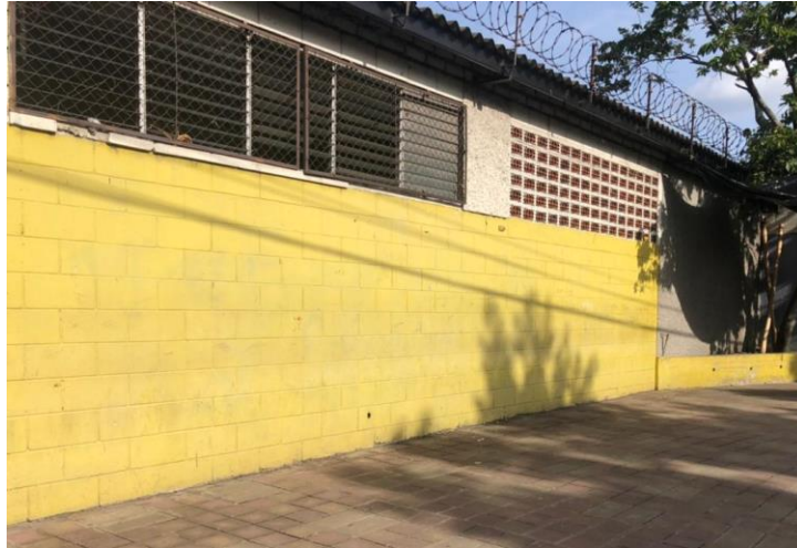
Ilustración 4, opción #1 lugar para intervención de mural.