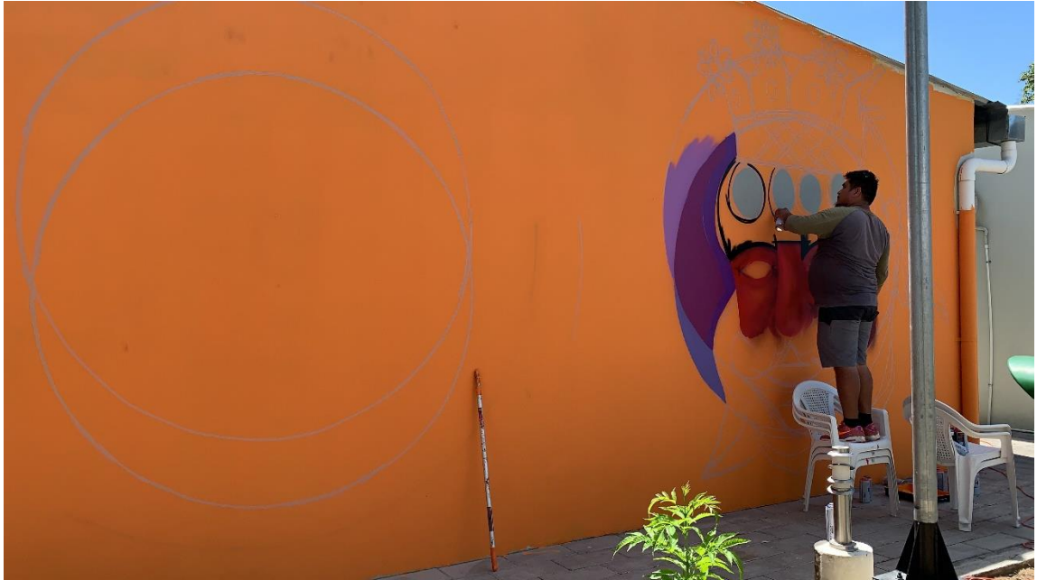
Ilustración 11, proceso de creación