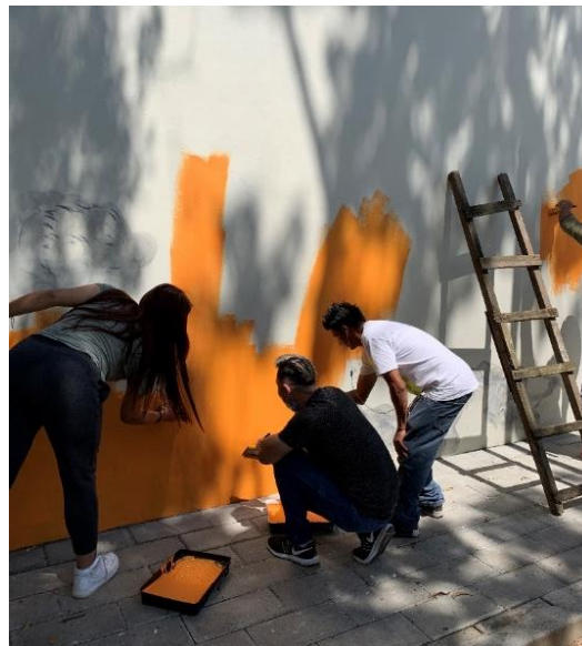
Ilustración 10, jóvenes de comité cuidarte sv, fotografía tomada por Boris Ayala.