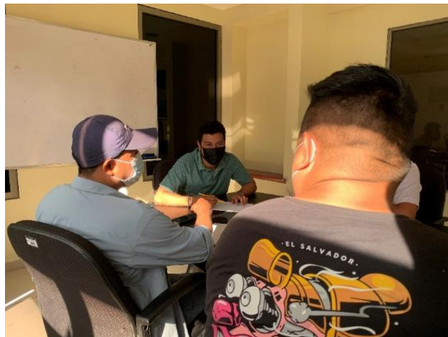
Ilustración 2, reunion con comite cuidarte sv, foto tomada por integrante de comite.