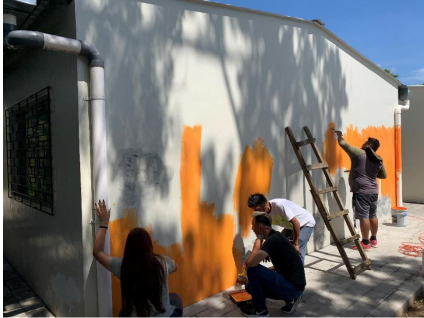
Ilustración 9, jóvenes de comité cuidarte sv apoyan al baseo de la pared, fotografía tomada por Boris Ayala