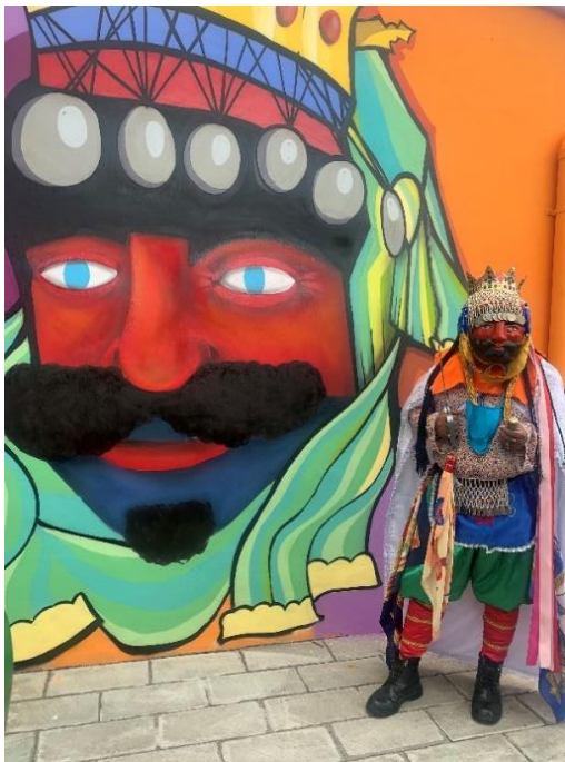
Ilustración 13, reinterpretación rey moro, fotografía tomada por Boris Ayala.

Se llegó a un acuerdo con la municipalidad, de dar seguimiento a esa tradición y otras más que no solo abarcan a ciudad Delgado sino también a Cuscatancingo, con el fin de generar un poco más de turismo en las ciudades.