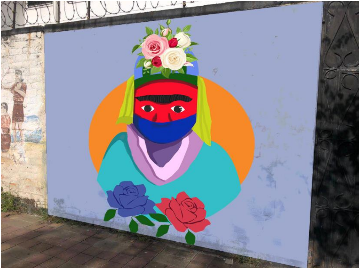
Diseño 1, montaje para segundo mural petición de la iglesia Centro catolico de San Sebastian, diseño Emerson Herrera

mayor impacto, se colocase en una pared de una zona céntrica y con alto volumen de transeúntes y vehículos.