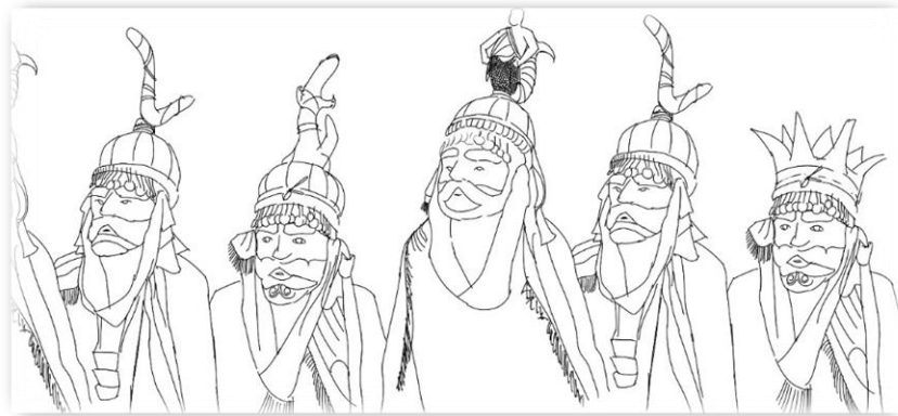
Ilustración 8, diseño presentado a comités para evolución, diseño Franco Dalí.