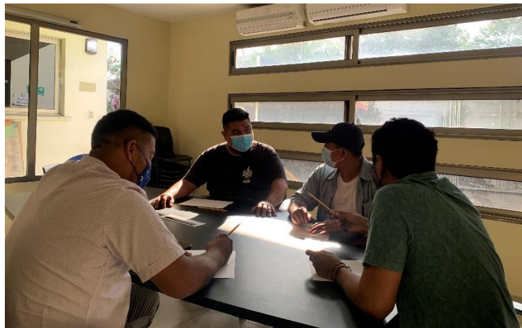
Ilustración 3, reunion con comite cuidarte sv, fotografia tomada por integrante de comite.

El scouting fue la búsqueda de los muros que se podrían intervenir, se dedicó un día a poder analizar los pros y contra de cada muro y analizar su factibilidad para adaptar las ideas graficas en ellos. El scouting se hizo acompañados de un representante del Comité Cuidarte SV y otro del comité Ex historiantes del barrio San Sebastián.