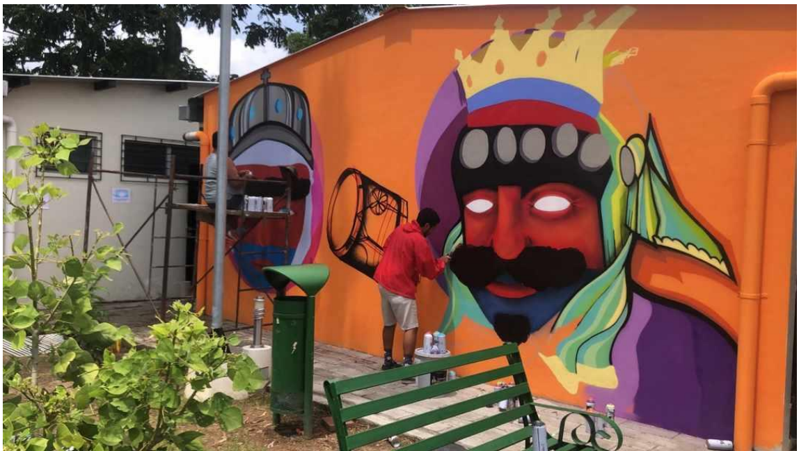
Ilustración 12, proceso de pinta mural moros y cristianos, fotografía integrante comité cuidarte sv.