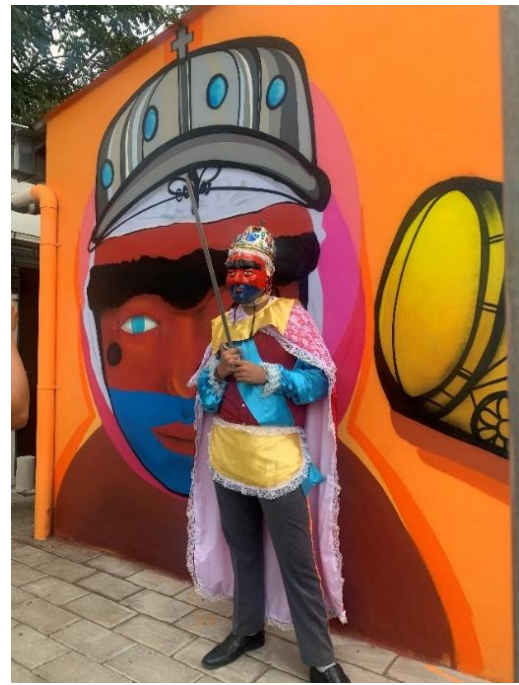
Ilustración 14, reinterpretación rey cristiano, fotografía tomada por Boris Ayala.