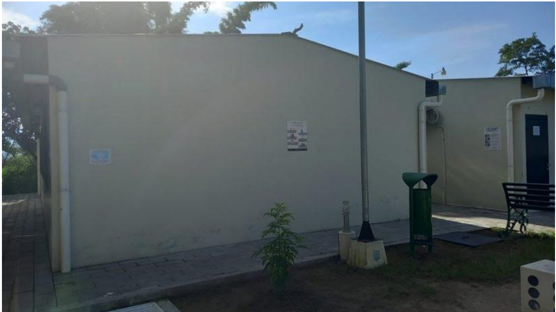
Ilustración 6, pared elegida, entrada principal de la casa de la cultura, Ciudad Delgado.

Esta pared fue elegida por su ubicación y su peso en la cultura del municipio de Ciudad Delgado y sus alrededores, ya que proporciona diferentes talleres a los jóvenes del municipio, y su afluencia de personas es alta.