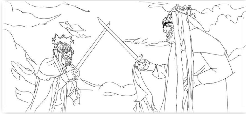
Ilustración 7, bocetería presentada a los comités para evaluación, diseño Franco Dalí