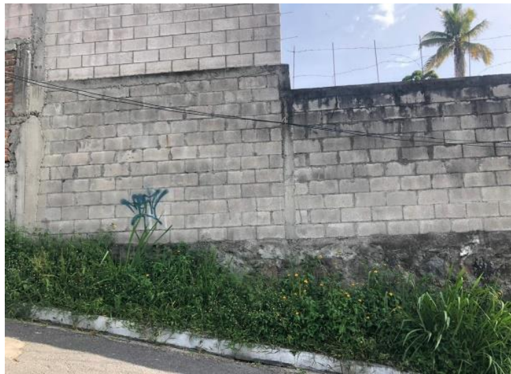
Ilustración 5, opción #2 lugar para intervención de mural.