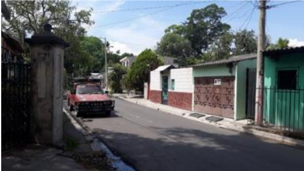
Imagen 3. Calle frente a la parroquia. Cantón La Palma, abril de 2021.

La parroquia está en una zona rural-mixta; cuenta con calles de asfalto y aspecto urbano, pero a sus alrededores hay áreas rurales y campestres.