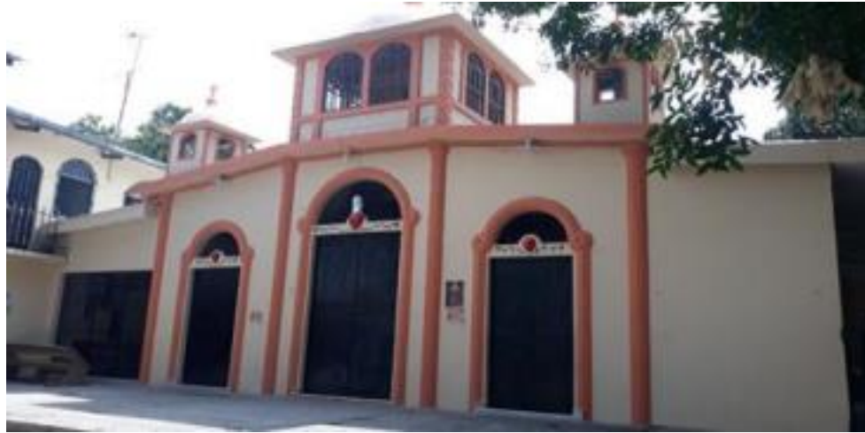
Imagen 1. Fachada principal, iglesia El Sagrado Corazón de Jesús, Cton. La Palma, San Martín, S.S. 2021.