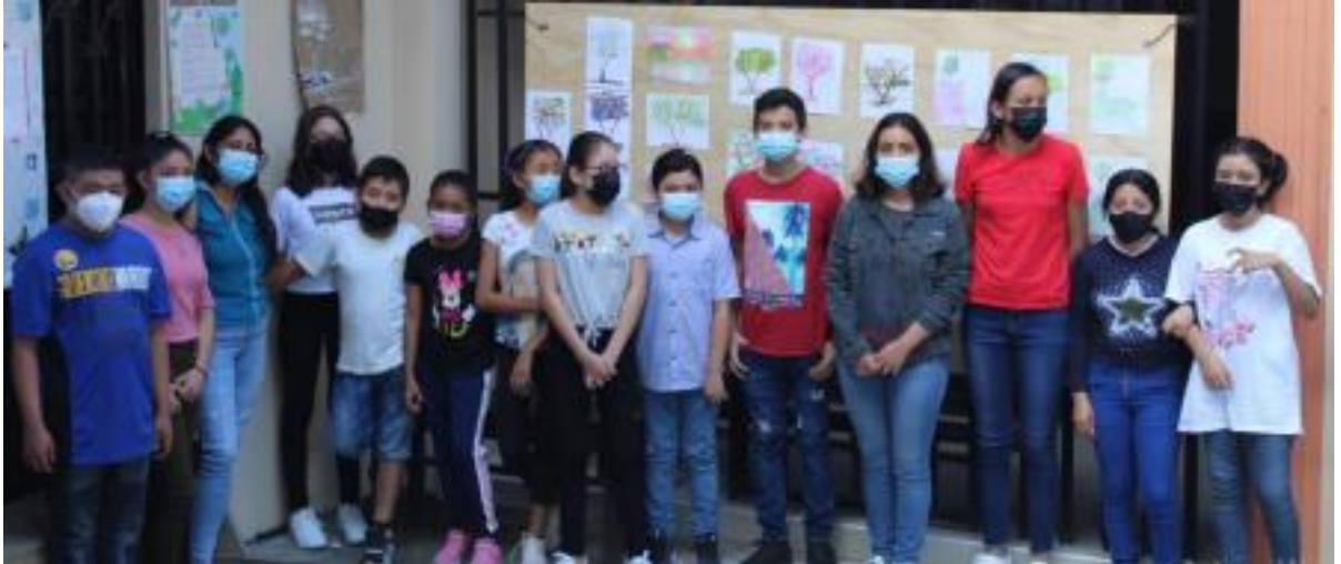
Imagen 6. Fotografía grupal durante el pació de convivio, atrás tablero con los trabajos finales de cada uno de los participantes.

Sobre el tema de la actitud, fue genial, los participantes en seis semanas de trabajo respondían de mejor manera, se les veía más seguros, confiados y dinámicos.