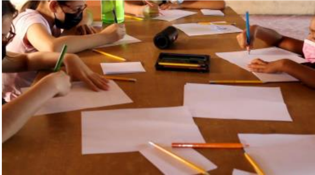
Imagen 5. Ejercicio de dibujo en una de las sesiones de clases del taller.

En cuanto a las actividades propiamente competentes con el desarrollo de la prueba piloto se describe y amplía sobre estas a continuación: