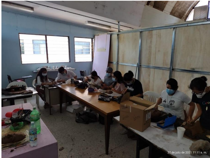
Note: elaboración de máscara cerámica por medio de modelado en barro, 2021, photo by K. Guandique.