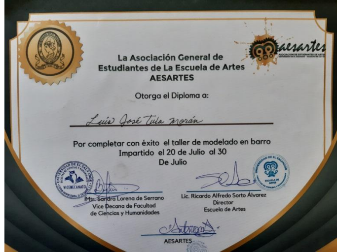
Note: diploma otorgado al finalizar taller, 2021, photo by J. Bolaños.