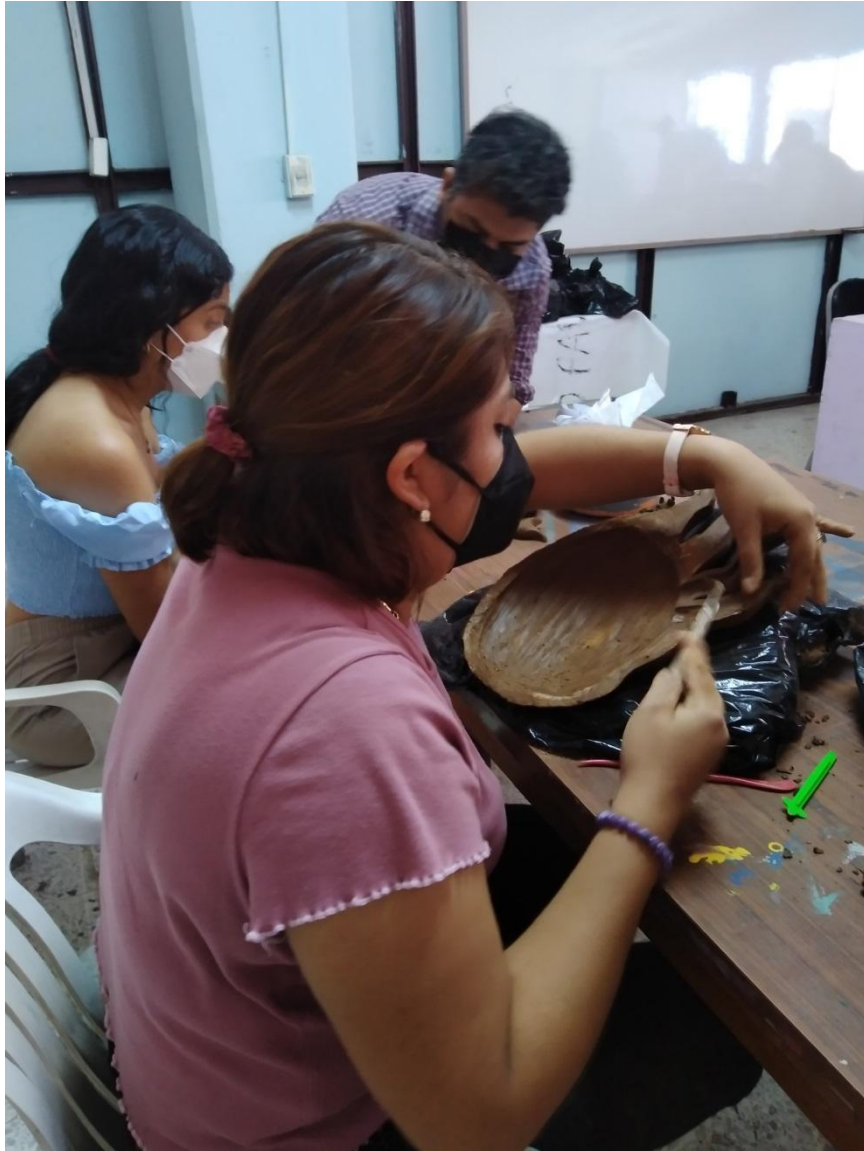
Note: proceso de ahuecado de mascara cerámica, 2021, photo by K. Guandique.