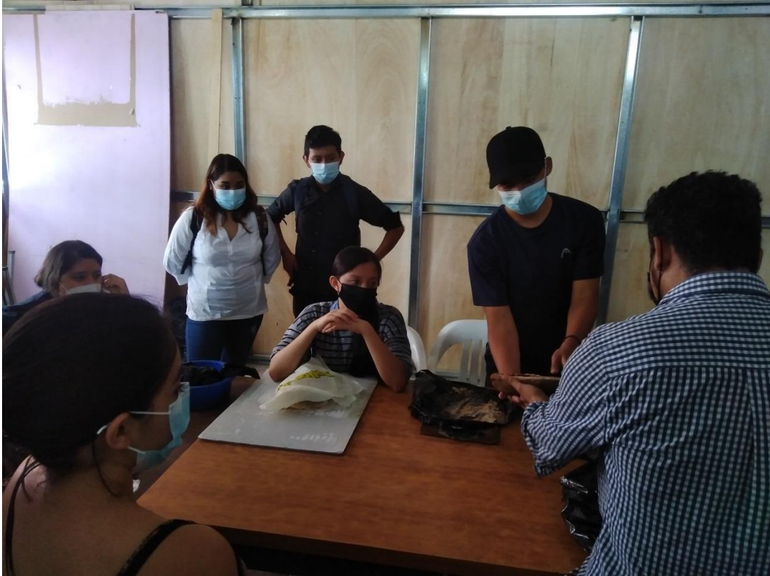
Note: explicación sobre materiales y procesos de modelado en barro, 2021, photo by C. Laínez