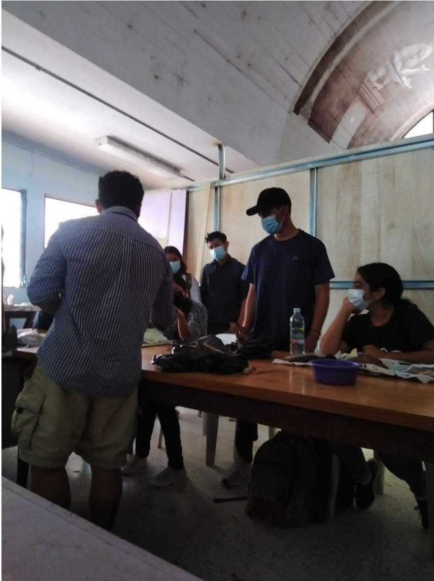
Note: explicación sobre materiales y procesos de modelado en barro, 2021