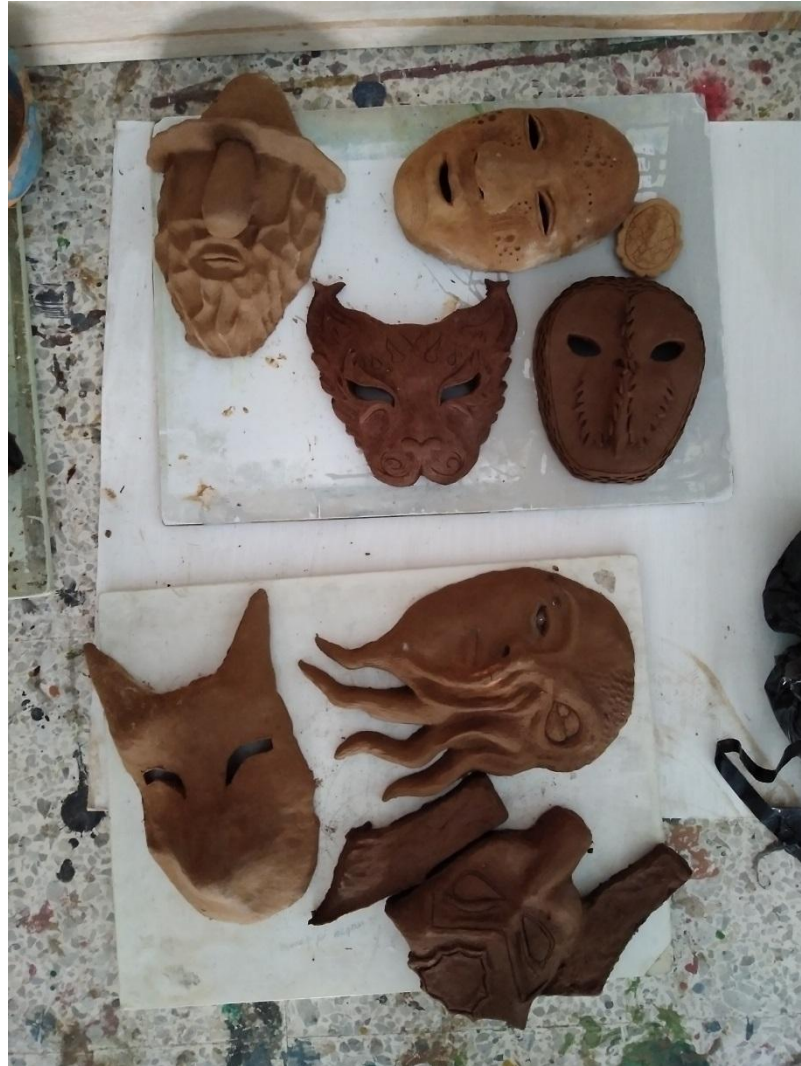
Note: piezas finalizadas en proceso de secado, 2021, photo by J. Bolaños.