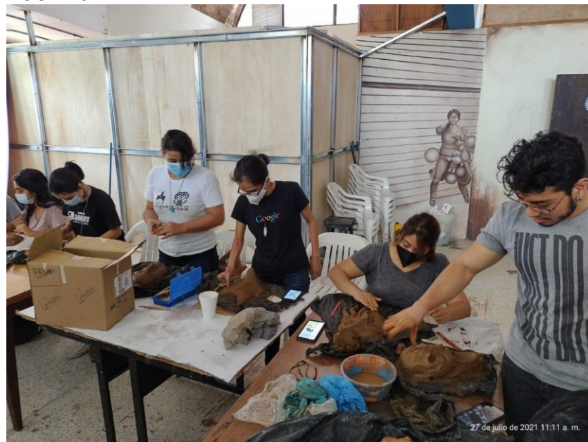
Note: elaboración de máscara cerámica por medio de modelado en barro, 2021.