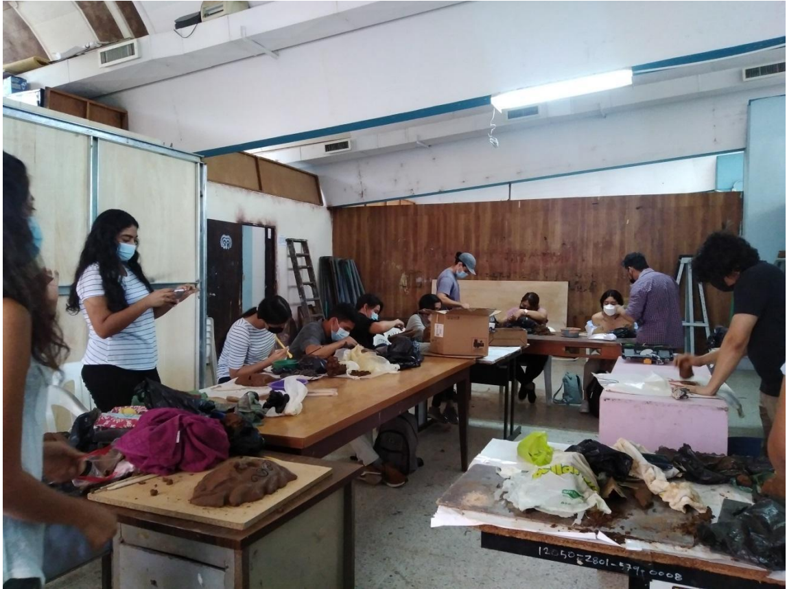
Note: elaboración de máscara cerámica por medio de modelado en barro, 2021, photo by K. Guandique.