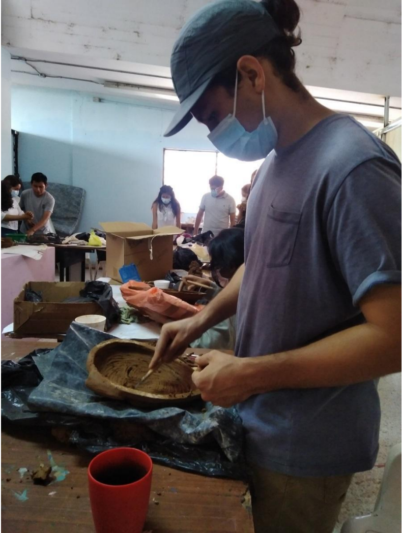
Note: proceso de ahuecado de mascara cerámica, 2021