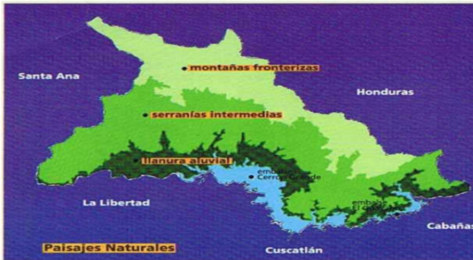
Fig.2 Paisajes Naturales de Chalatenango

La Mancomunidad La Montaña, dispone de un diagnóstico ambiental del departamento, denominado Plan Departamental de Manejo Ambiental (PADEMA 1 ), en el cual plantea el mapa de ubicación de paisajes naturales (Fig.2). El mencionado diagnóstico, se refleja en un cuadro síntesis (cuadro 1) las características biofísicas de los paisajes naturales del departamento, ambos se consideran relevantes para conocer el contexto de intervención.