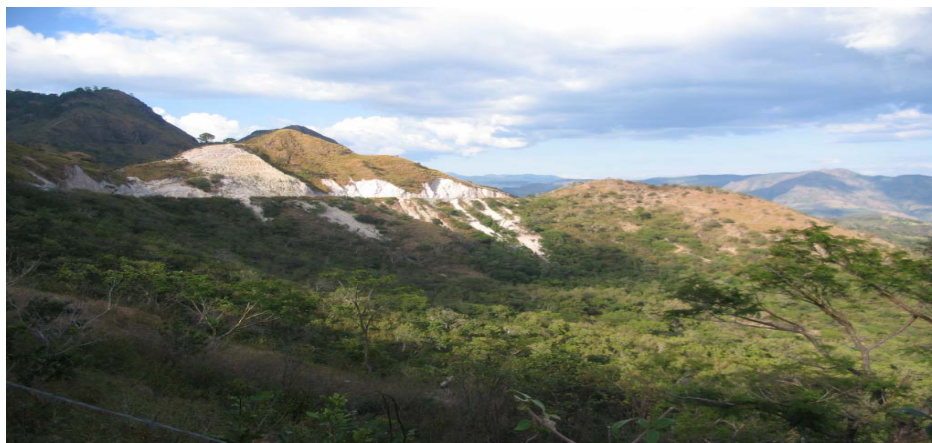
Fig. 3. Vista panorámica de la carretera perimetral que bordea la Montaña, Chalatenango. En una zona de alta fragilidad ambiental

Para el logro de este objetivo según lo establecido en el PNOTD a fin de poner en marcha esta estrategia se han formulado propuestas y programado actuaciones en las siguientes materias: