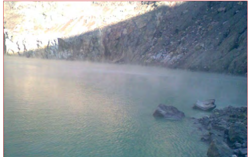
Interior del cráter del Volcán de Santa Ana acercamiento a la laguna sulfurosa del fondo.