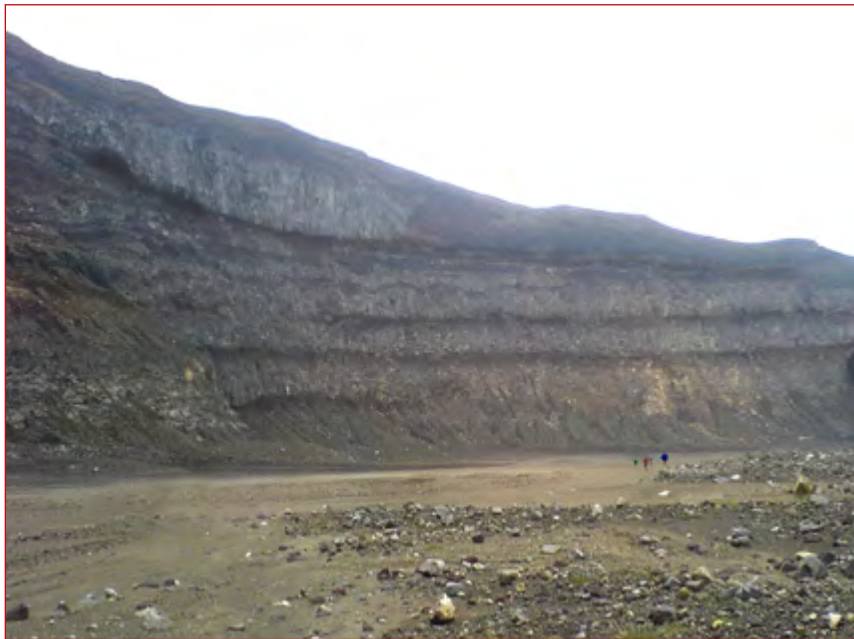
Interior del cráter del Volcán de Santa Ana en el anillo inicial, nótese las dimensiones al compararlo con las personas del fondo.