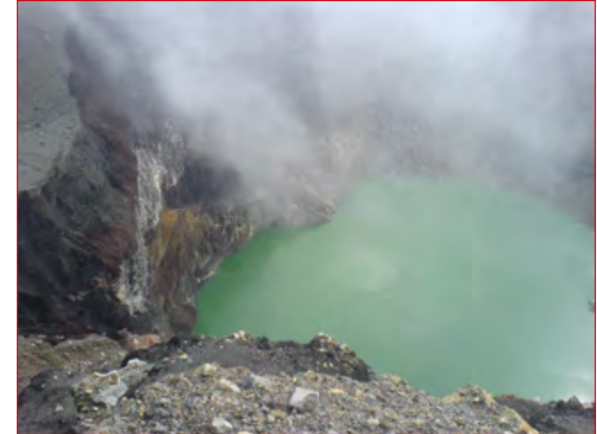
Laguna verde de aguas sulfurosas en el fondo del cráter del Volcán de Santa Ana.

En el fondo de su cráter se puede observar una laguna verde de aguas sulfurosas, que permanentemente emanan gases. El volcán de Santa Ana estuvo muy activo durante el siglo XVI, antes de 1524, hasta después de 1576; posteriormente hizo erupción en los siguientes años: 1621, 1874, 1904, 1920 y 1937; estas últimas sincrónicamente con las de Izalco. La última erupción del volcán de Santa Ana fue reportada el 01 de octubre de 2005