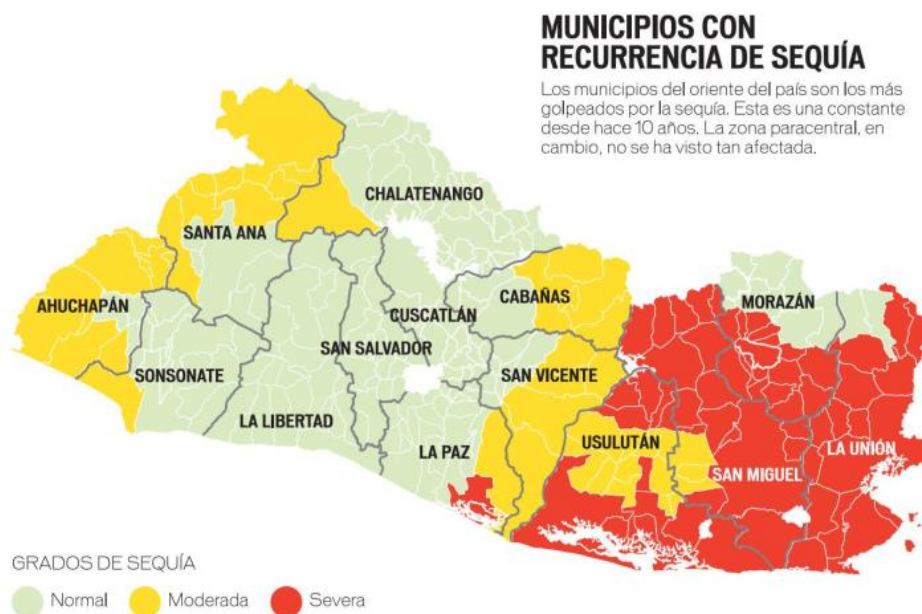
Ilustración 4. Municipios con recurrencia de sequía