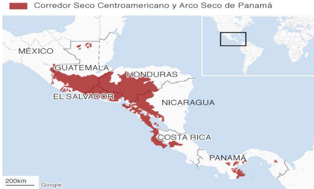
Ilustración 3. Áreas incluidas en el Corredor Seco de Centroamérica

*El criterio utilizado para la delimitación del corredor está basado en las zonas cuya época seca es mayor a cuatro meses