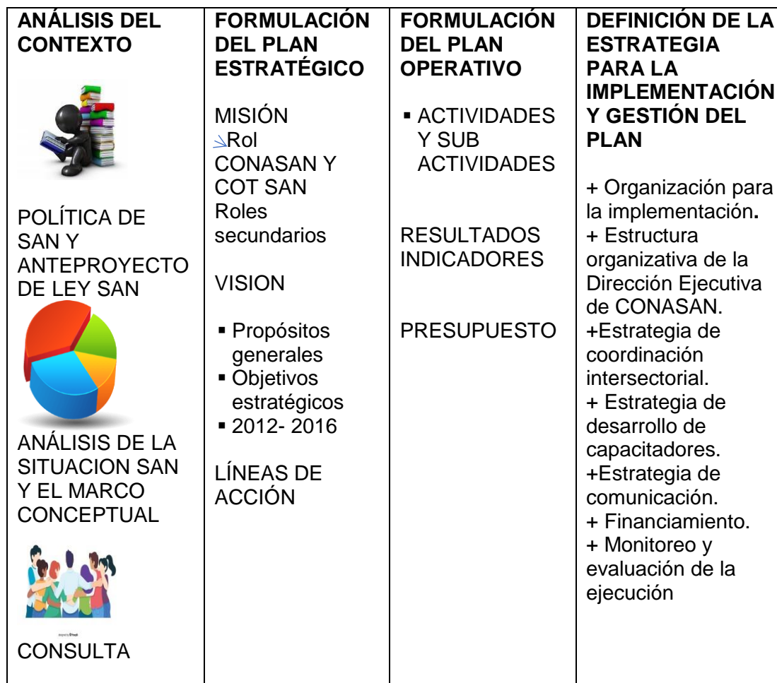
Cuadro 3. Proceso de formulación del Plan estratégico nacional de Seguridad Alimentaria y Nutricional 2013 - 2016

Fuente: Elaboración propia con base en Consejo Nacional de Seguridad Alimentaria y Nutricional, CONASAN. Plan estratégico nacional de Seguridad Alimentaria y Nutricional 2013 – 2016