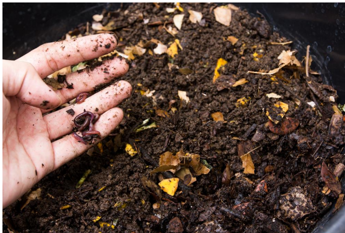
Figura 8: Abonos orgánicos

La contaminación ambiental es un problema que ha incrementado con el paso de los años, por una sociedad consumista con falta de educación ambiental, las empresas de índole comercial también pueden convertirse en un ejemplo para frenar esta problemática, implementando pequeñas acciones que a largo plazo pueden generar grandes cambios en la sociedad, la marca puede iniciar una producción de un tipo de abono, elaborado a base de la pulpa del café junto a otros ingredientes. Este no contendrá en su fórmula ningún químico que pueda poner en riesgo la salud de las personas o de la misma naturaleza, por consiguiente, será de carácter orgánico.