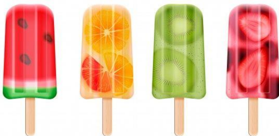
Figura 13: Paletas de frutas de carácter ilustrativo

A pesar que las minutas son las favoritas para muchas personas, se encuentran otros que prefieren degustar postres con textura más suaves como las paletas por consiguiente con la implementación de esta estrategia se obtendrá un segmento de mercado más amplio.