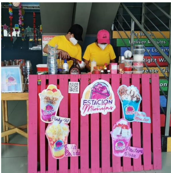
Figura 12: Colaboradores de estación de minutas