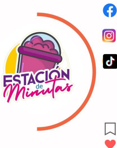
Figura 14: Comunidad en redes sociales