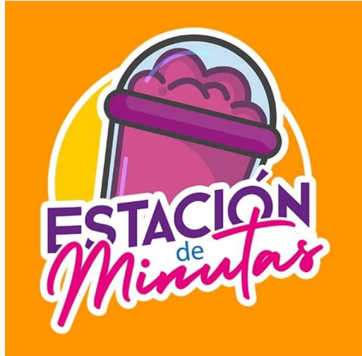
Figura 9 : Logo de estación de minutas

En sus inicios la idea principal del negocio consistía en asistir a eventos, exposiciones de emprendedores, no era establecerse en un espacio físico, el primer evento que tuvieron fue en el museo del ferrocarril de San Salvador.