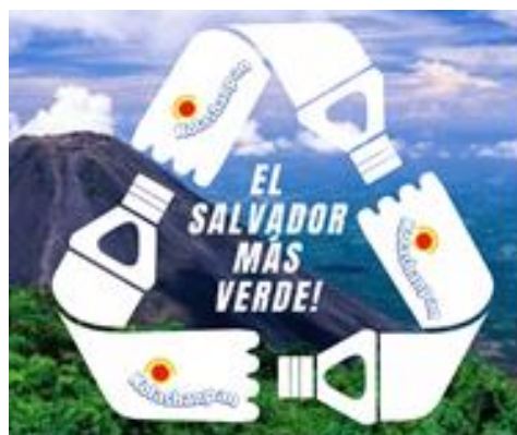
Figura 4: Campaña de mkt social

Utilizar en sus nuevos envases un porcentaje de material reciclado, crear por lo menos tres veces al año campañas de limpieza en ríos, playas y parques apoyados con spots en redes sociales para que dichas campañas hagan eco en la mente del consumidor salvadoreño.