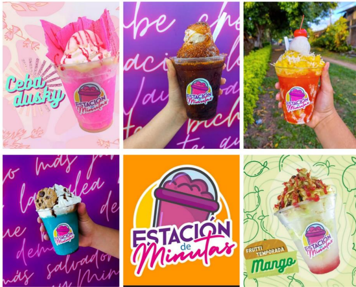
Figura 10: Opciones de minutas gourmet