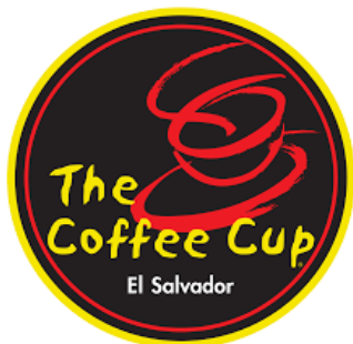
Figura 5: Logo The Coffee Cup