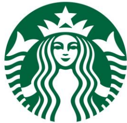
Figura 6: Logo de Starbucks

regresen con frecuencia ya sea para compartir un momento en familia, con amigos, compañeros de estudio o trabajo.