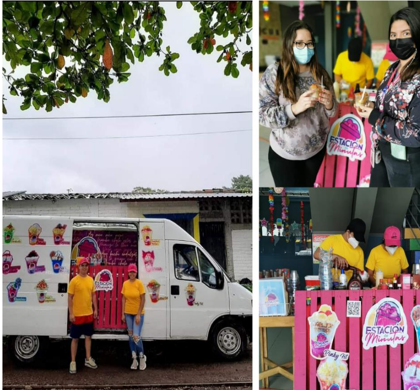
Figura 11 Minuta móvil