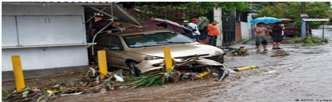
FUENTE TOMADO DE: DW MADE FORMIN, Una semana de lluvias deja 30 muertes en El Salvador en plena pandemia, El Salvador, 07/06/2022