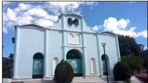
Parroquia San Bartolomé Mártir de la Liberación