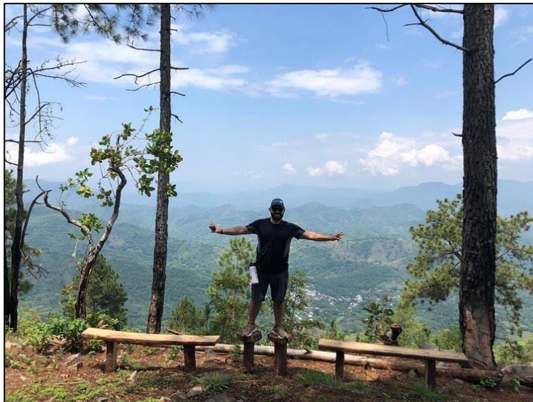
Cerro Histórico La Cañada

La caminata tiene una duración completa de 4 a 5 horas, con un costo de $30 por grupo de máximo 10 personas, la cual incluye un guía especializado en el recorrido a seguir, información sobre los puntos turísticos a visitar, zona de descanso, agua y refrigerio.