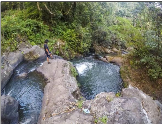
Cascada El Barío

La cascada y su río sirve de línea divisoria entre El Salvador y Honduras. Esta caminata tiene un costo de $25, con el que se brinda un guía, poder bañarse en la cascada y servicio de transporte ida y regreso al pueblo de Arcatao. Si se quiere ingresar con vehículo 4x4, tiene un costo adicional, reduciendo el tiempo de la caminata para comodidad del turista.