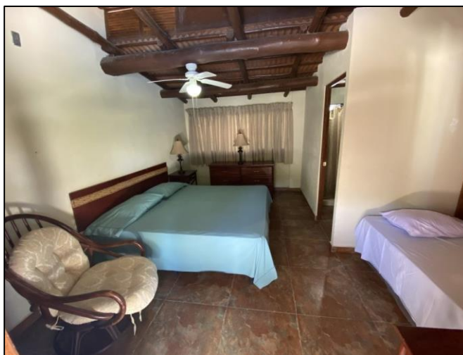
Habitación del área/ambiente La Casona, en el Hotel Las Golondrinas.

La Estancia: se encuentra en los límites del casco urbano, proporcionando conexión con el paisaje natural y un delicioso ambiente de tranquilidad. Cuenta con cabañas independientes y baño privado, con una piscina de agua de río, que se mantiene con un caudal constante, el cual es reciclado para diferentes proyectos de riego. Así mismo, cuenta con un salón de usos múltiples, zona de comedor y una cocina completamente equipada.