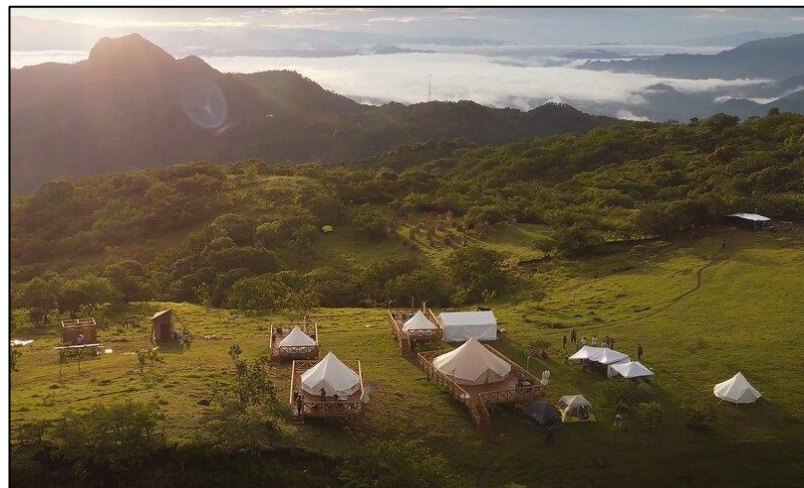
Área de glamping, Cerro Las Libélulas