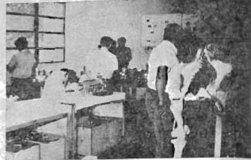
El Departamento de Ciencias Biológicas instaló un interesante pabellón.

Otro de los importantes aspectos de la celebración de la citada Semana Cultural, lo constituyeron las actividades de tipo permanente tales como: Exposición de Trabajos Científicos de los Departamentos de Ciencias, Exposición Pictórica y de Fotografía, lo mismo que exhibición de la Maqueta de la Ciudad Universitaria y Exposición de la Librería Universitaria.