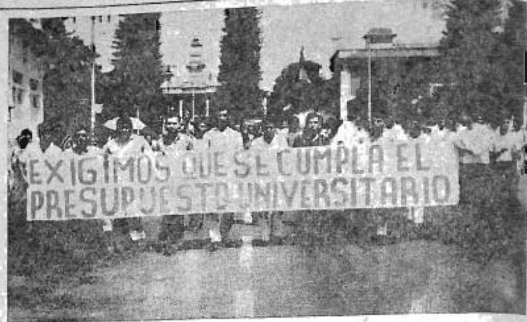
Grandes carteles recordaban al gobierno el deber que tenía de entregar a la Universidad los dineros que el pueblo aporta para su educación superior y que violando decretos y acuerdos se negaba hacer efectivos.