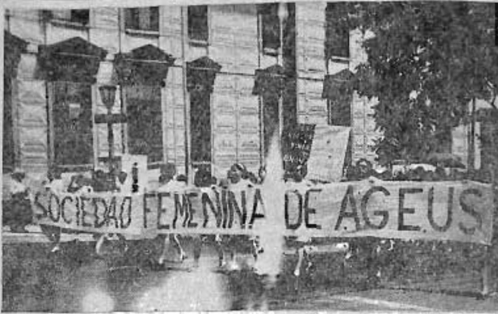
Con significativo ímpetu ha surgido la Sociedad Femenina de la AGEUS y ha logrado constituirse en una nueva fuerza dentro de la Universidad. En las luchas recientes por el presupuesto del Alma Máter, fue notoria la presencia de la mujer universitaria.