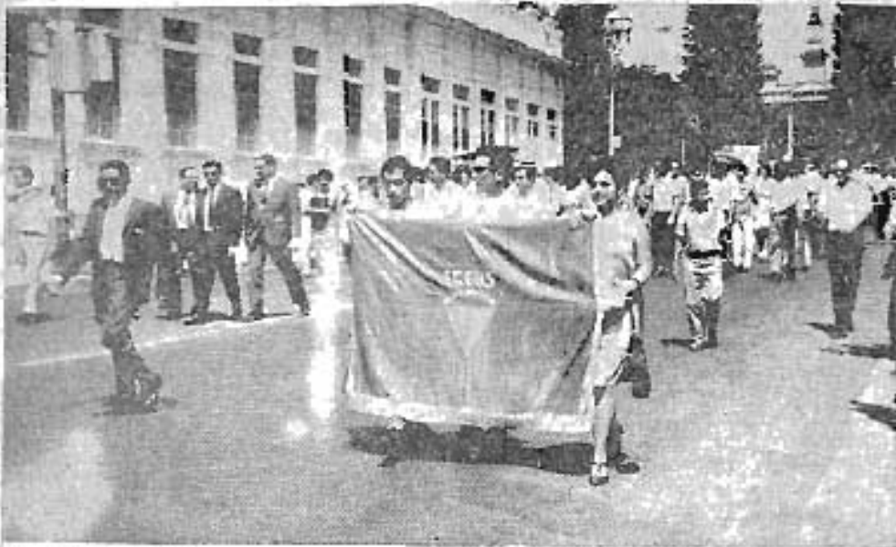
La AGEUS siempre presente, encabezaba la acción tendiente a lograr que se cumpliera el mandato legislativo y constitucional de proporcionar a la Universidad los fondos para su funcionamiento.