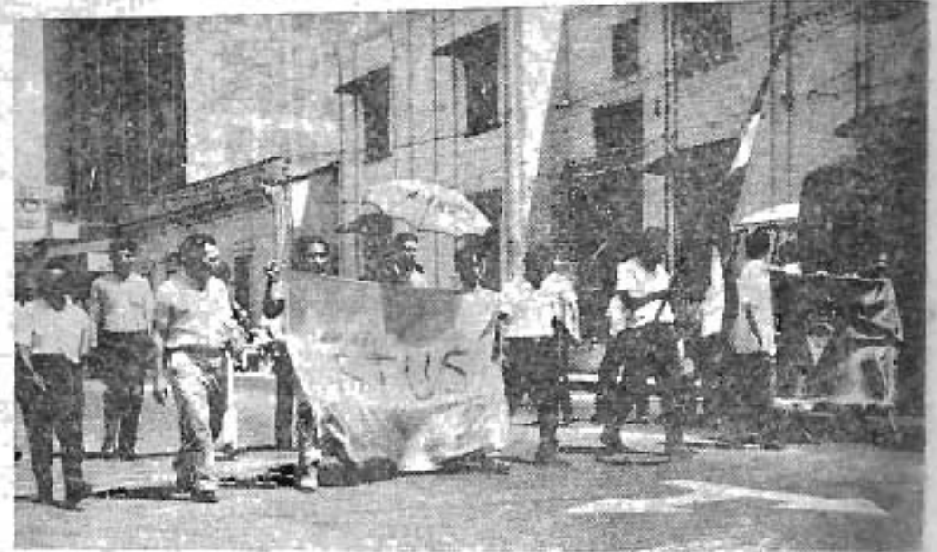
Los trabajadores universitarios desfilaron por las calles ocupando varias cuerdas de la manifestación que se dirigió a la Asamblea Legislativa y al Ministerio de Hacienda, en acciones combinadas de toda la Comunidad Universitaria hasta lograrse lo propuesto.