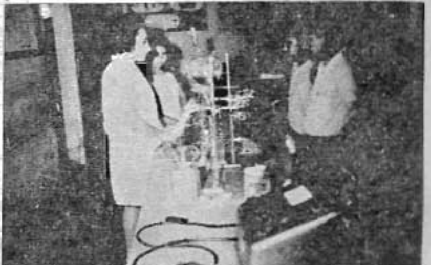
Esta es la sección correspondiente al Departamento de Ciencias Químicas.