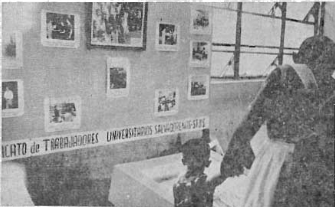
El Sindicato de Trabajadores Universitarios Salvadoreños presentó también una exposición fotográfica que recoge aspectos de las acciones del último año, en lo referente a la lucha sindical.