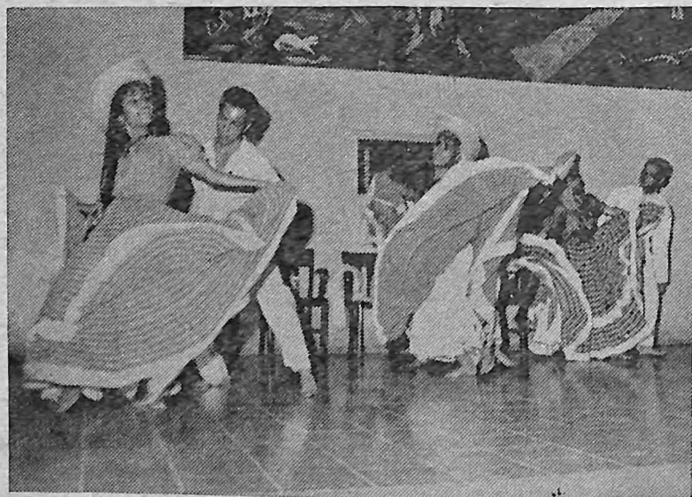
En las celebraciones del Día del Estudiante, organizadas por el Congreso Estudiantil de la AGEUS, tuvo destacada participación el Conjunto de Danzas Folklóricas de nuestra Universidad.