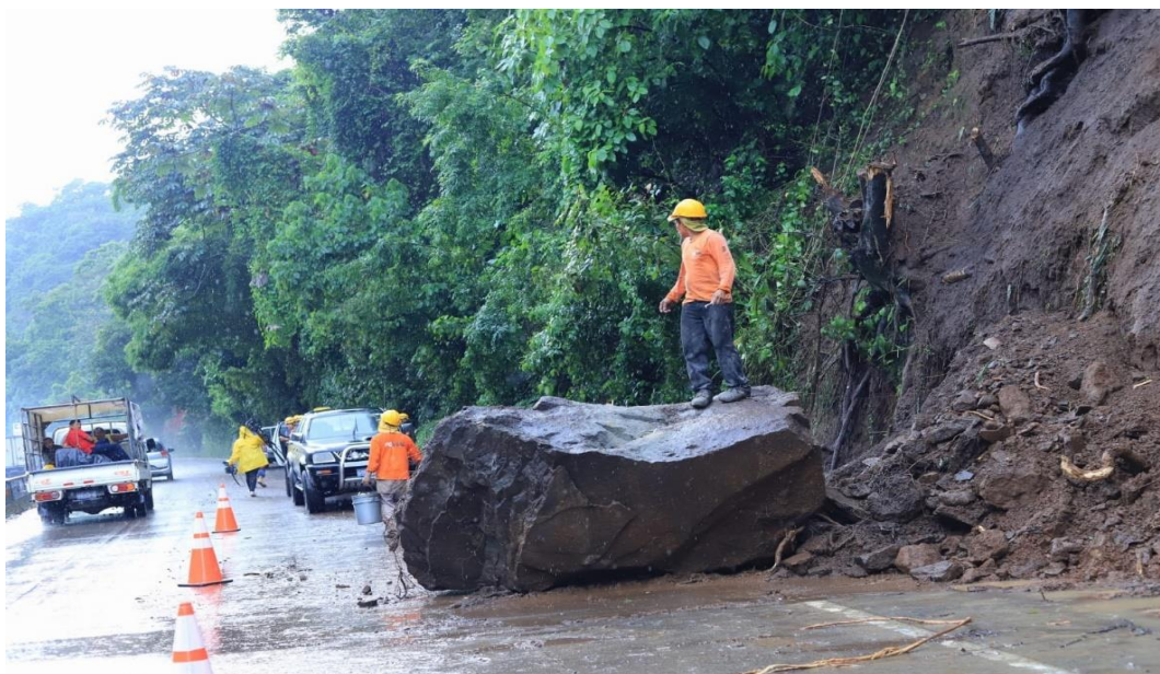
Fotografía No. 2: carretera los chorros, septiembre 2022.