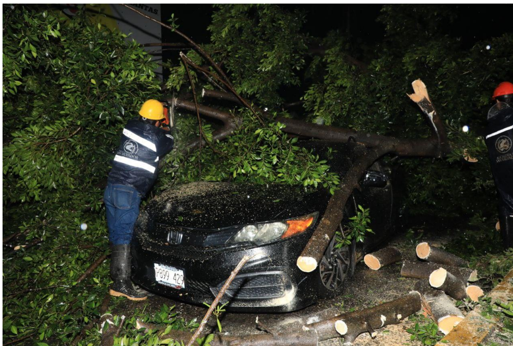
Fotografía No. 3: Diario El Salvador, San Salvador 22 junio de 2020