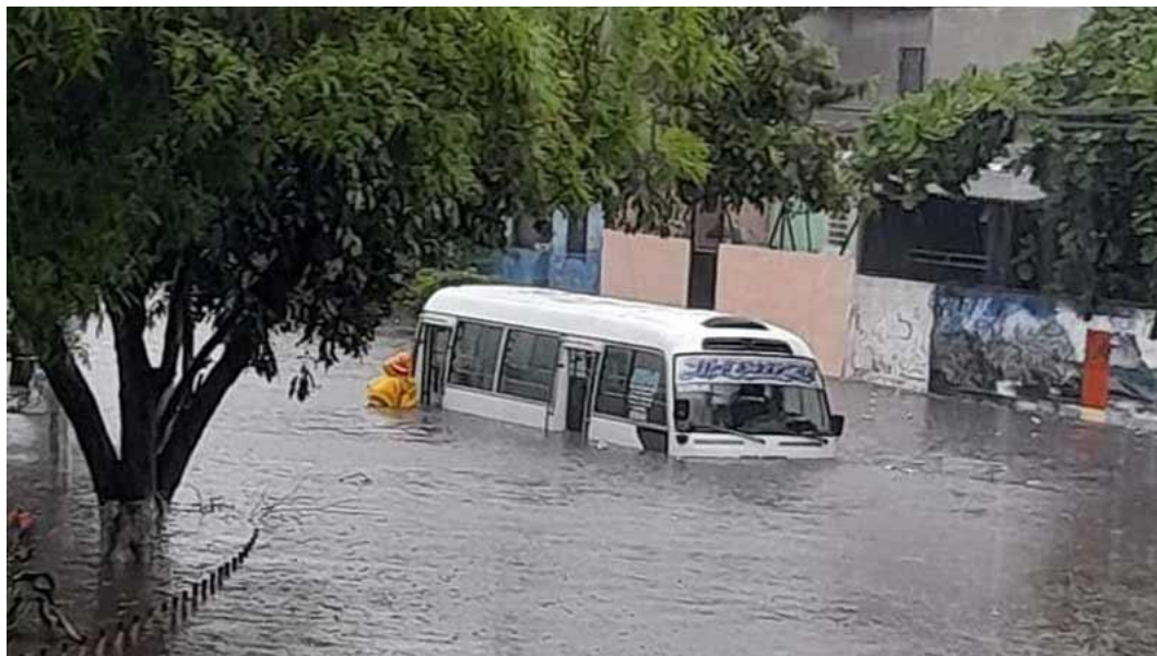
Fotografía No. 1: periódico digital elsalvador.com, Santa Lucia 22 julio 2022