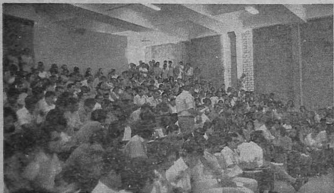
El Auditorium del Instituto de Ciencias Naturales y Matemáticas se convirtió en el lugar histórico donde durante veinte días discutió el Primer Congreso de Estudiantes de Areas Comunes. Este Congreso se caracterizó por el amplio espíritu democrático que en él hubo en todo momento para tratar cuestiones trascendentales relativas a la reforma universitaria, principalmente en la reestructuración de las Areas Comunes.

El hecho anterior nos sitúa ante una perspectiva alentadora: los jóvenes estudiantes que hoy cursan Areas Comunes pronto ingresarán a las Facultades y llevarán a ellas sangre nueva para imprimirles acción también a esas unidades. Muchas de éstas se hallan entrabadas en los viejos esquemas de la Universidad tradicional y a estas alturas del desarrollo la juventud pugna por remover todo cuanto obstaculiza el desenvolvi-