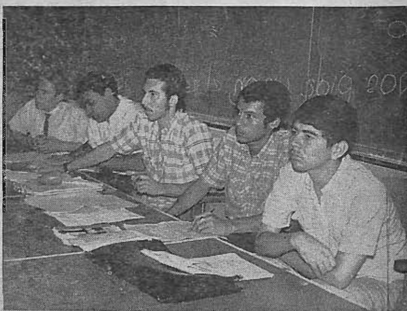
En este cónclave reformista los estudiantes evaluaron importantes programas académicos y docentes. Las resoluciones obtenidas después de largas discusiones, fueron analizadas y aprobadas muchas de ellas, por el Consejo Superior Universitario. A la izquierda la Directiva del Primer Congreso Estudiantil de Areas Comunes la cual se caracterizó por su capacidad y buen sentido en la orientación de los debates.

el proceso de reforma en las Areas Comunes; enjuiciar los objetivos académico-filosóficos del área básica partiendo de la realidad nacional y universitaria; asimismo, definir con claridad el carácter y orientación de la docencia en ese sistema y por último motivar al estudiantado para que participe activamente en el proceso de reforma universitaria. Estas cuestiones generales fueron desglosadas en el temario del Congreso y analizadas a fondo durante los veinte días que duró el mismo.