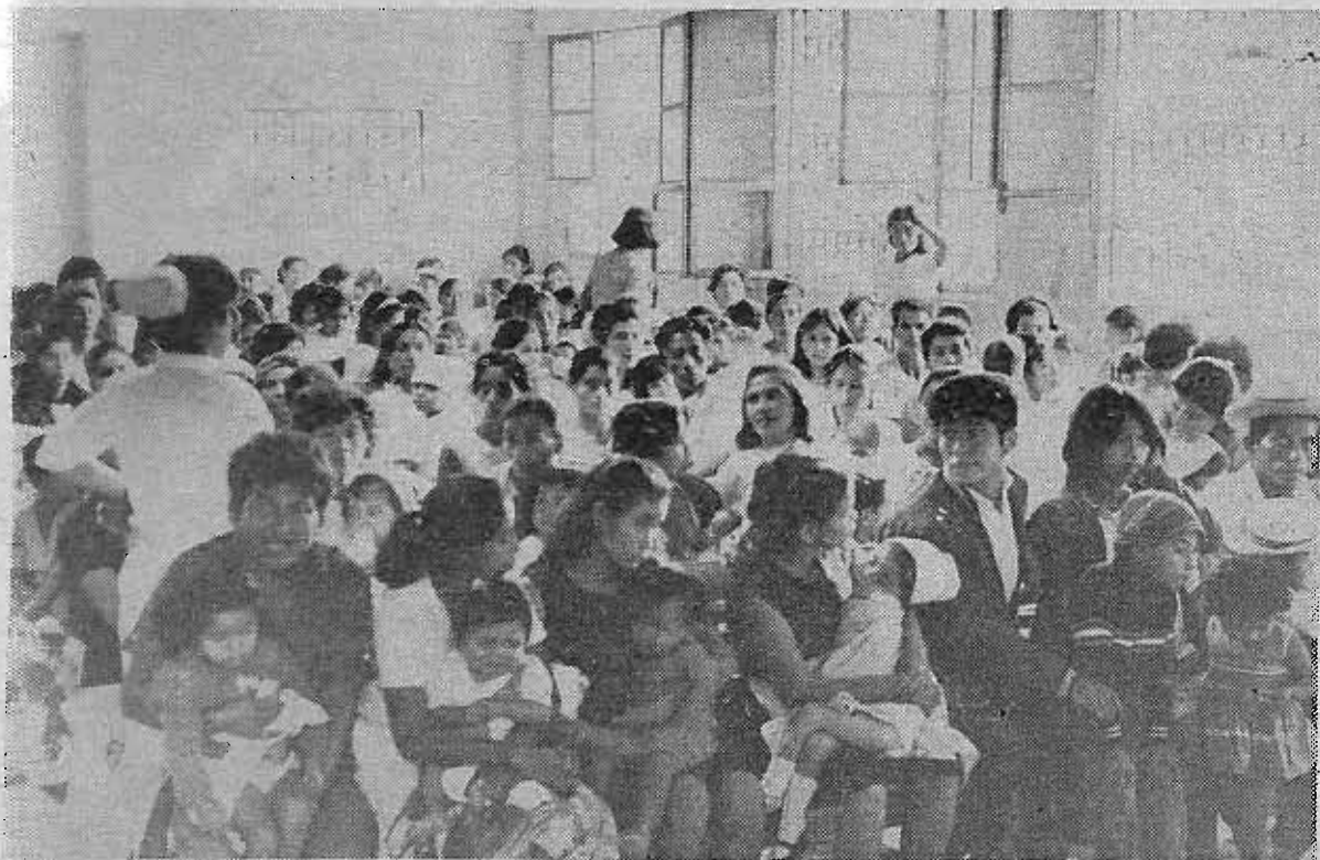
Con motivo de haberse celebrado el 5 de octubre el día internacional de los derechos del niño, la demagogia gubernamental, pseudo-filantrópica y mercantilista, ha aprovechado la ocasión para tratar de hacer creer que de veras se preocupa por la situación de nuestros niños: la realidad nacional demuestra todo lo contrario.

Una visita al Bloom: Crónica del infierno