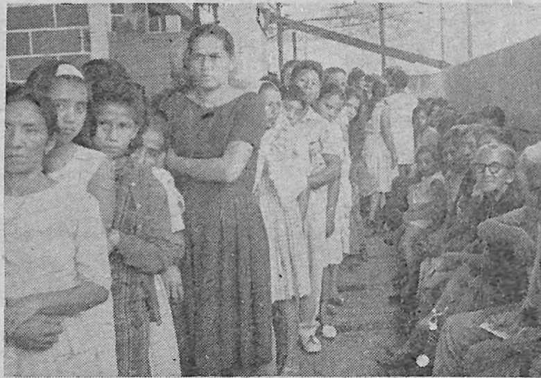
LOS HOSPITALES DE SAN SALVADOR son escenarios diariamente de cruces espectáculos: los pacientes sufren dolorosas enfermedades mientras esperan ser atendidos. El gobierno de la República, siguiendo con su línea de cargar al pueblo con contribuciones e impuestos, dispone desde hace algún tiempo solicitar a los pacientes que llegan a los centros hospitalarios "dos colones voluntarios".

Sería muy importante que el Ministro de Salud Pública diera una información al público sobre la razón que ha tenido el Ministerio a su cargo para contratar profesionales, muchos de los cuales no cumplen ni con el horario, pese a que el propio Ministro en su informe a la Asamblea dijo que el presupuesto de Salud Pública es insuficiente y que se solicita un fuerte refuerzo de 7 millones para el próximo año. ¿El aumento servirá para gorroves o para comprar medicinas? El resto del personal, en particular el personal de enfermería, no recibirá ninguna mejora.