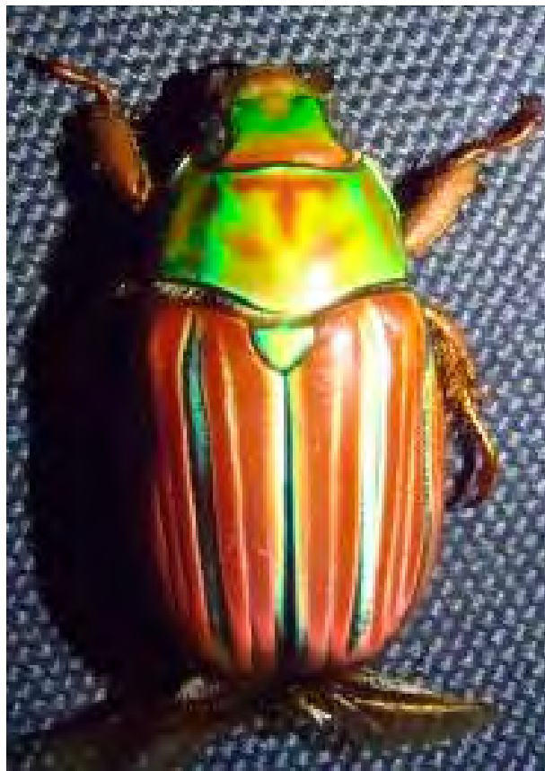
Fig. 4. Chrysinia Qetzalcoatl (Coleoptera: Scarabaeidae) encontrado en el Cerro El Pital Cierra de Alotepeque-El Salvador.