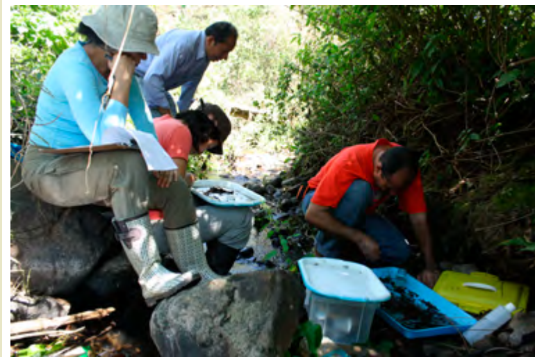
Análisis de muestras extraídas en el marco del proyecto “Determinación de la calidad ambiental de las aguas de ríos en El Salvador, aplicando el índice biótico por familias (IBF-SV)”