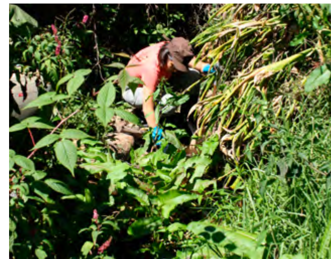
En búsqueda de insectos acuáticos en el marco del proyecto “Determinación de la calidad ambiental de las aguas de ríos en El Salvador, aplicando el índice biótico por familias (IBF-SV)”