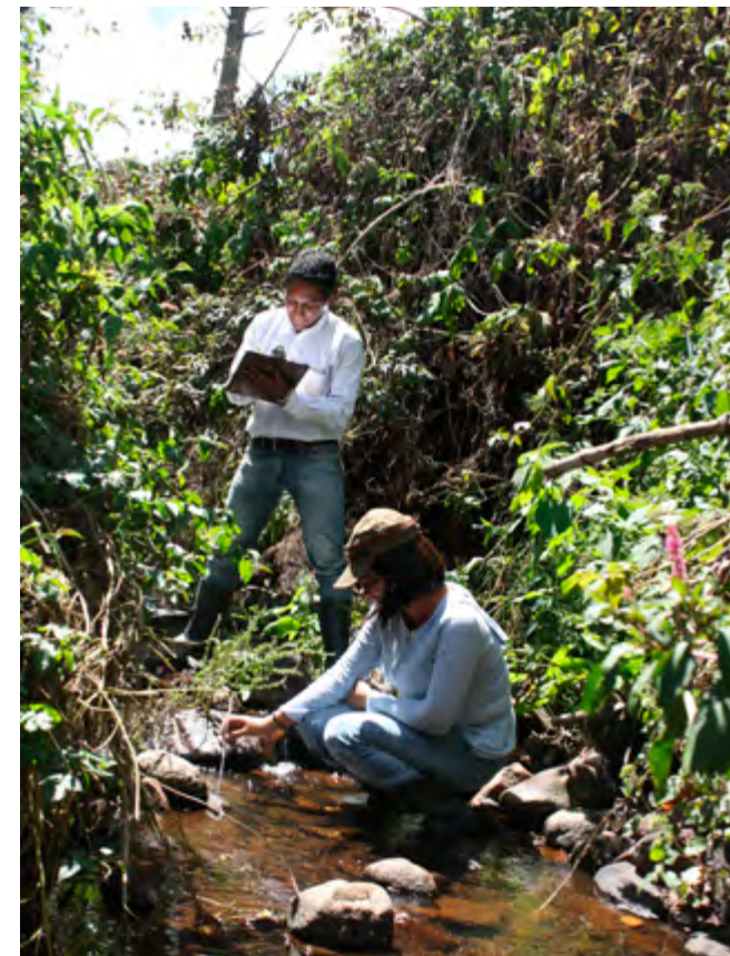
Análisis Físico - Químico en la cuenca alta del río Sumpul, El Salvador. Equipo investigador UES.