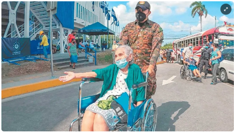
Atención El proceso de vacunación es bastante ágil, en el Hospital El Salvador y en las unidades de salud.

LPG Por Evelyn Machuca 22 DE ABRIL DE 2021 00:00 HS - GMT-6