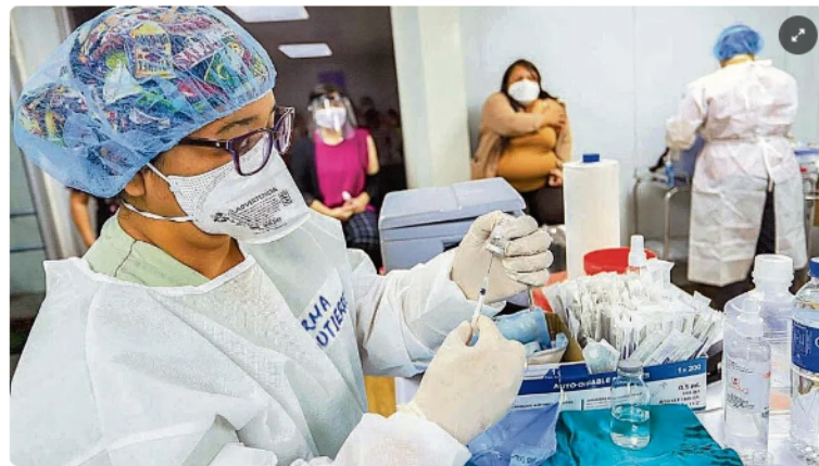
Reserva. El MINSAL decidió que el plan de vacunación no debe ser público.

LPG Por Denni Portillo 26 DE MARZO DE 2021 00:00 HS - GMT-6