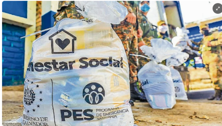
Paquetes. La compra de paquetes solidarios fue una de las acciones con poca transparencia.

LPG Por Laura Jordán 23 DE ABRIL DE 2021 00:00 HS - GMT-6