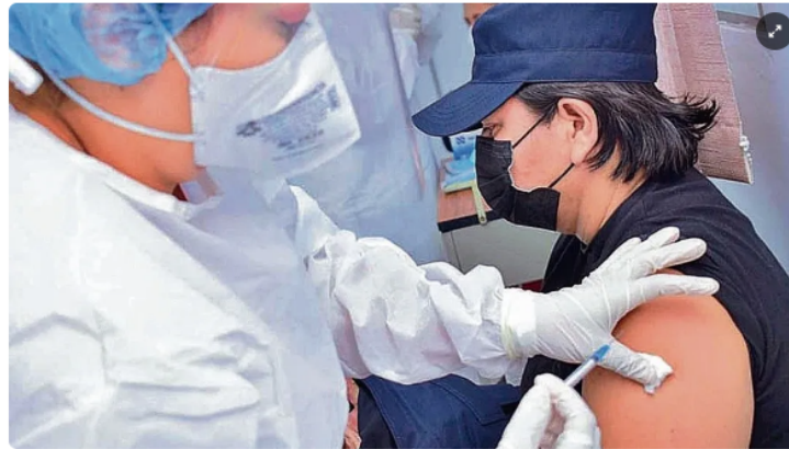
Vacunación. Actualmente, el GOES vacuna a policías y militares de la FAES.

LPG Por Denni Portillo 25 DE MARZO DE 2021 06:00 HS - GMT-6