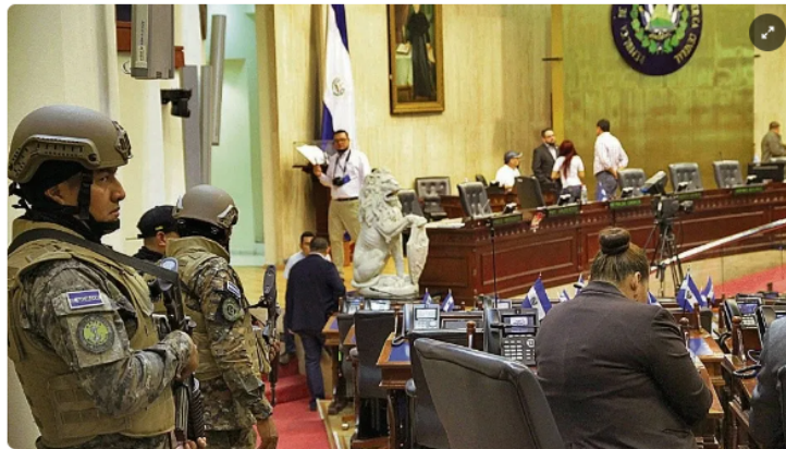
Señalamientos. El Departamento de Estados Unidos consideró el 9F como un intento de interferir con la independencia de la Asamblea.

LPG Por Denni Portillo 31 DE MARZO DE 2021 00:00 HS - GMT-6