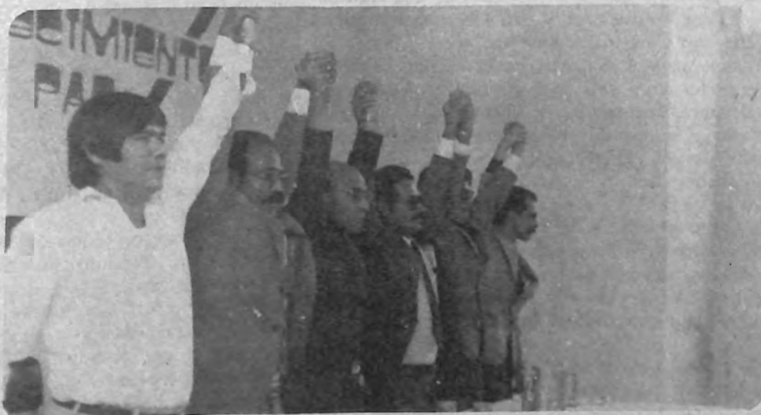
ACTO FINAL. Al clausurar la Jornada Nacional por el Diálogo y la Paz, los organizadores reafirmaron su disposición a la búsqueda de alternativas políticas a la guerra.

Las ponentes demandaron el respeto, como