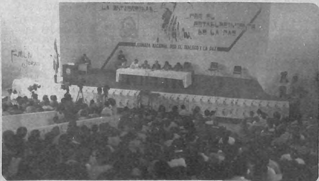
ASISTENTES. Aspecto parcial del desarrollo de la Jornada Nacional por el Diálogo y la Paz.

En el mismo tenor, abogó por un gobierno de amplia participación, que resuelva las deman-