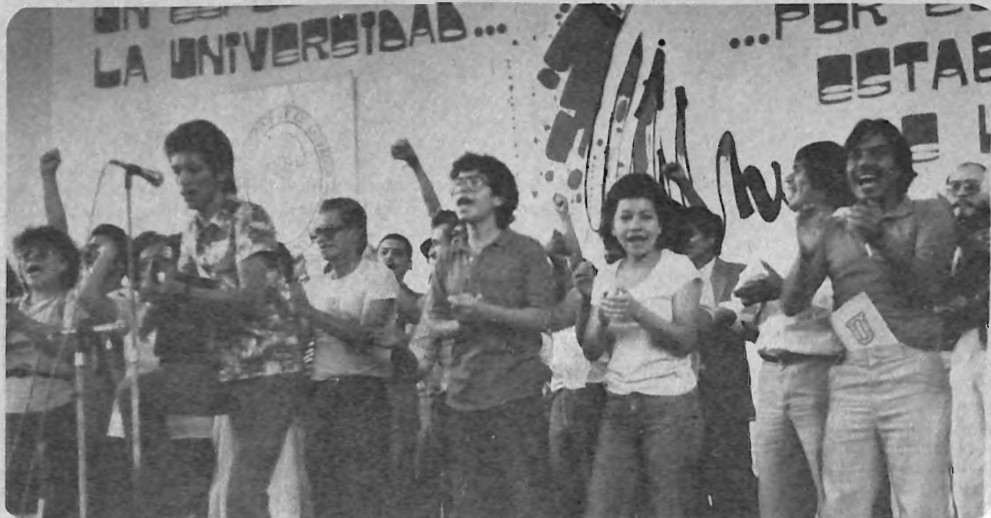
EUFORIA UNIVERSITARIA. Al cierre de la II Jornada Universidad por la Paz, cundió la alegría y el canto optimista en la lucha por la Paz.

La Universidad de El Salvador al realizar esta II Jornada, en el marco de su institucionalidad de ente rector de la educación superior, pretende jugar un papel constructivo en el proceso de la búsqueda de la paz y el logro de un futuro mejor para el pueblo salvadoreño, causa y fin último de su existencia.