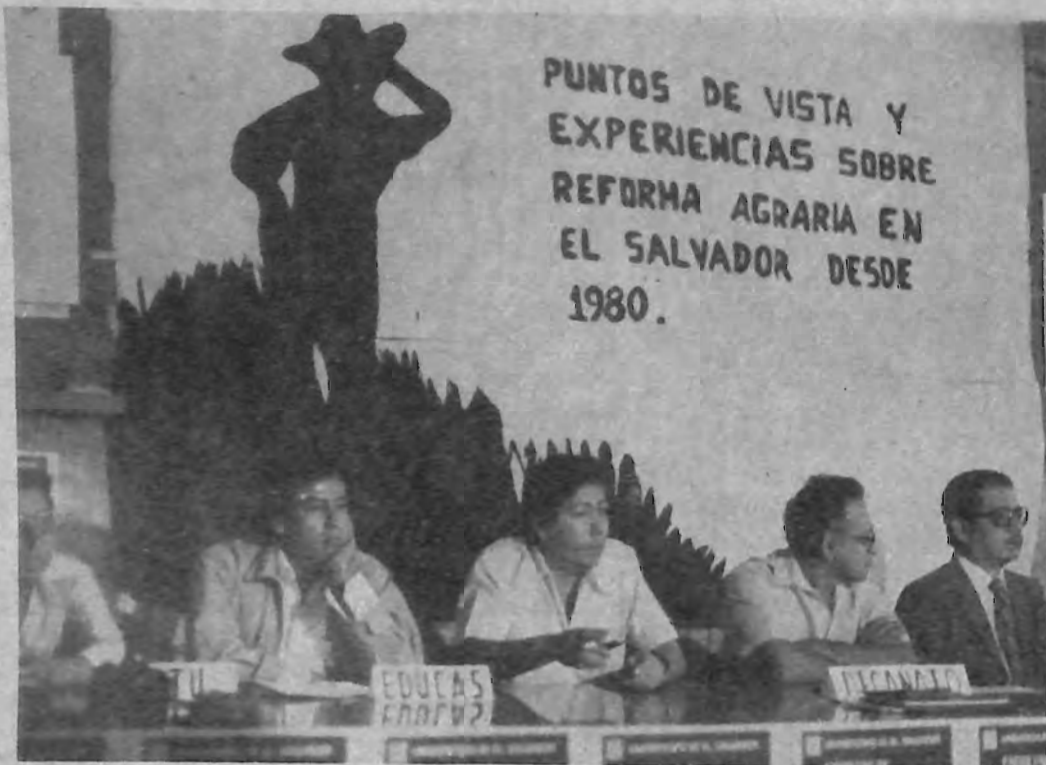
FORUM SOBRE REFORMA AGRARIA. Mesa que presidió el acto de Inauguración del "Forum sobre Puntos de Vista y Experiencias de la Reforma Agraria en El Salvador". Organizado por la Facultad de Ciencias Agronómicas.