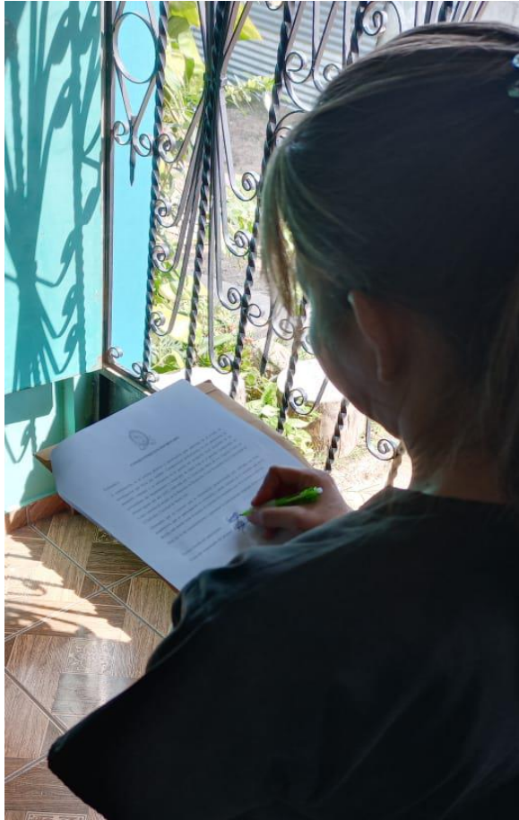
Firmando consentimiento para ser entrevistados