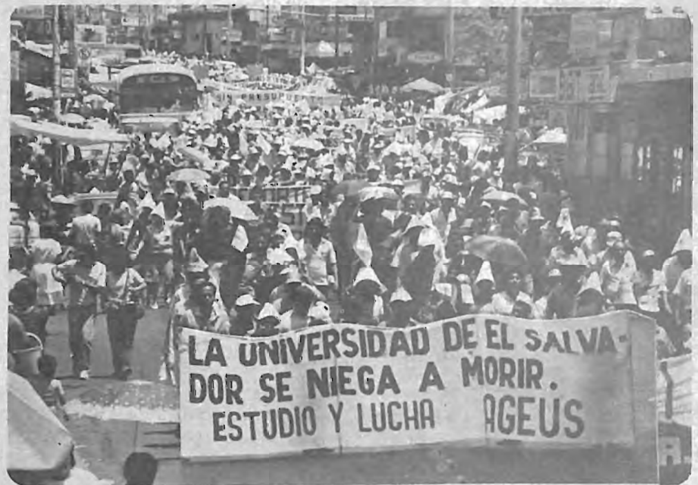
Diversidad de expresiones se han manifestado en las marchas que la Universidad de El Salvador ha realizado en pro de un justo refuerzo presupuestario.