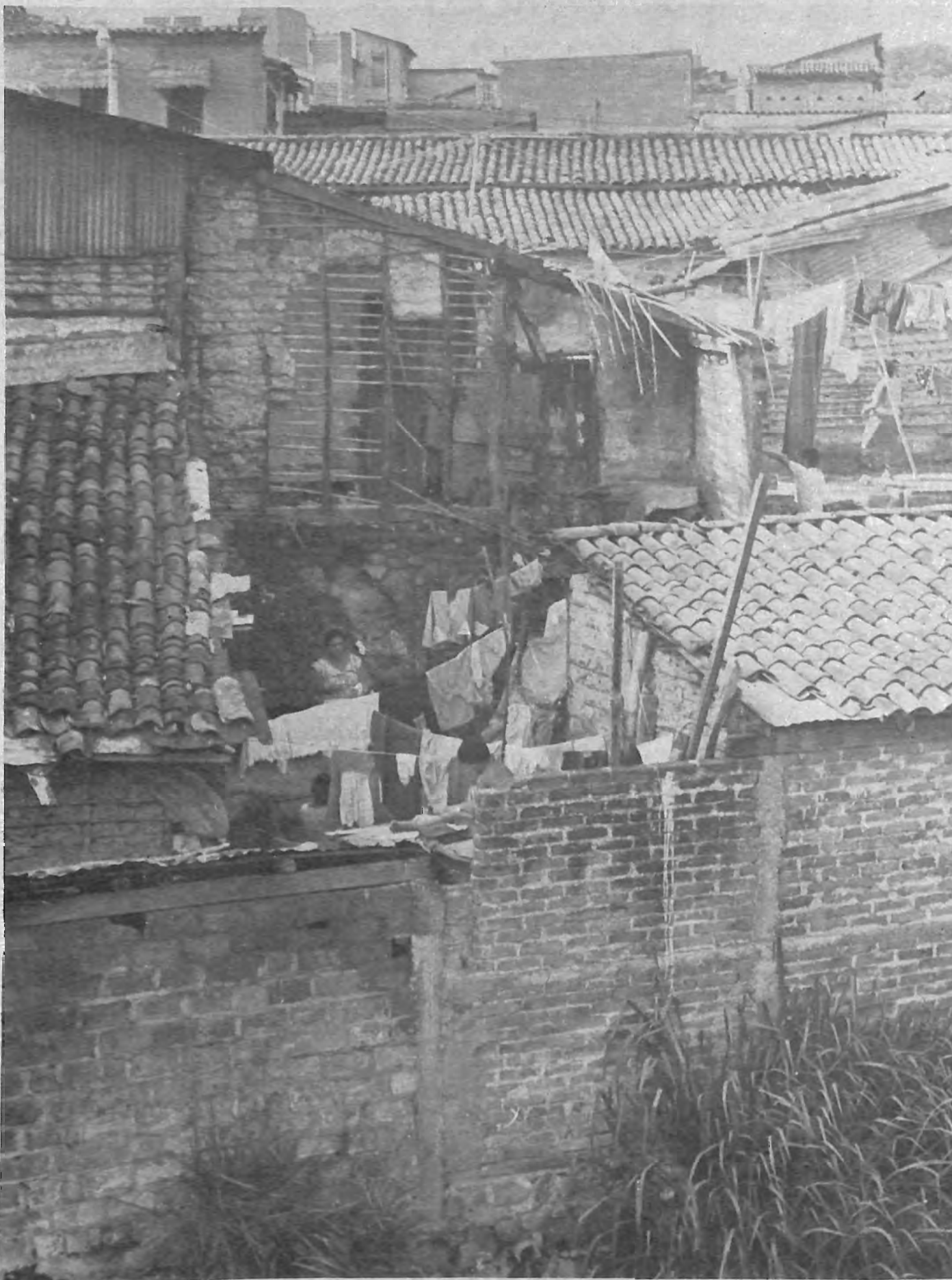
MESONES. Condiciones habitacionales de la gran mayoría del pueblo salvadoreño.

De hecho, estas medidas sólo pueden ser implementadas por un Estado democrático cuyo interés primordial sea la satisfacción de las necesidades populares, sobre la base de una organización social participativa y pluralista.