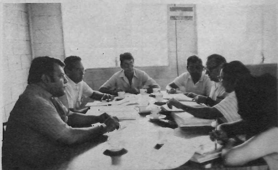
VISITA UES. Miembros de la Dirección Central de Contabilidad Centralizaron el pasado 7 de junio las oficinas de contabilidad de la UES, para determinar observaciones sobre los informes de caja presupuestal y liquidación presupuestada de la institución en 1987.