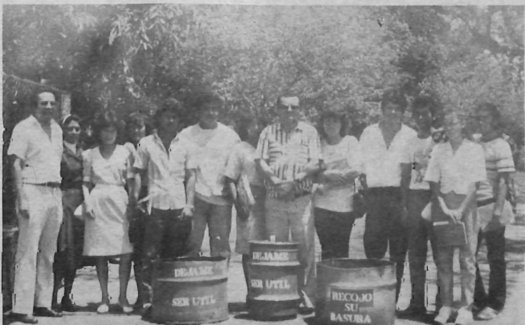
PROMUEVEN CAMPAÑA. Estudiantes y docentes del Centro Universitario de Occidente promovieron la semana pasada una campaña de protección del medio ambiente como parte de las celebraciones del día del Medio Ambiente salvadoreño.

Ciudad Universitaria, San Salvador República de El Salvador, Centroamérica