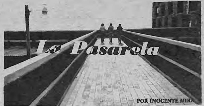
—POR INOCENTE MIRA—

"EL UNIVERSITARIO" se une al regocijo de la iglesia y pueblo salvadoreño, en esta oportunidad que la Universidad de Lovaina concede un justo reconocimiento a Monseñor Oscar Arnulfo Romero, al otorgarle el título de Doctor Honoris Causa; y expresamos nuestra satisfacción y felicitaciones al Arzobispo salvadoreño.