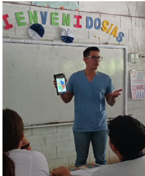
Imagen 3. Momento en que se explica la dinámica a los estudiantes

La segunda actividad fue el juego “ Rueda de las emociones ” Cada jugador en su turno giró la flecha, nombraron la emoción que podía ser felicidad, enojo, tristeza y miedo, describieron alguna situación en la que se ha sentido en esa emoción, para alguno adolescente fue más difícil que otros encontrar un momento que representara la emoción. Al finalizar se brindó una retroalimentación.