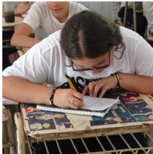
Imagen 5. Estudiante realizando la actividad “mi proyecto de vida”

La tercera actividad fue el taller “ Mi proyecto de vida ”. Cada estudiante en una hoja de papel plasmó de forma sintetizada su proyecto de vida, previamente se les explicó lo que es un proyecto de vida, los pasos que podían seguir para realizar la actividad, posteriormente se les dio tiempo para que pudieran realizar su proyecto de vida de manera individual.