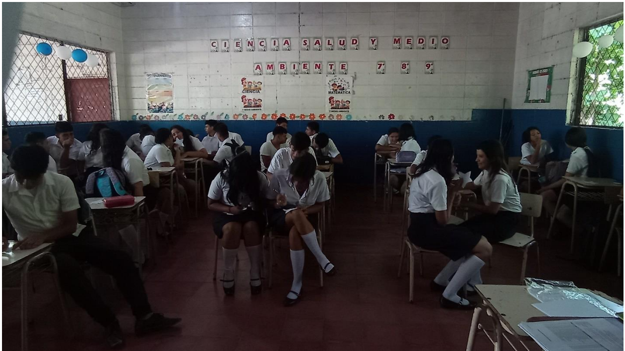
Descripción: Estudiante de noveno grado realizando Test de inteligencia emocional.