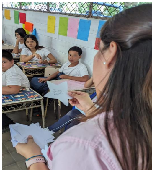
Imagen 2. Lectura de las estrellas