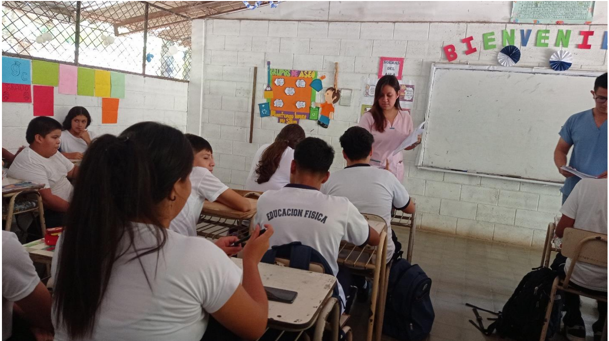
Descripción: Entrega de Test de inteligencia emocional.