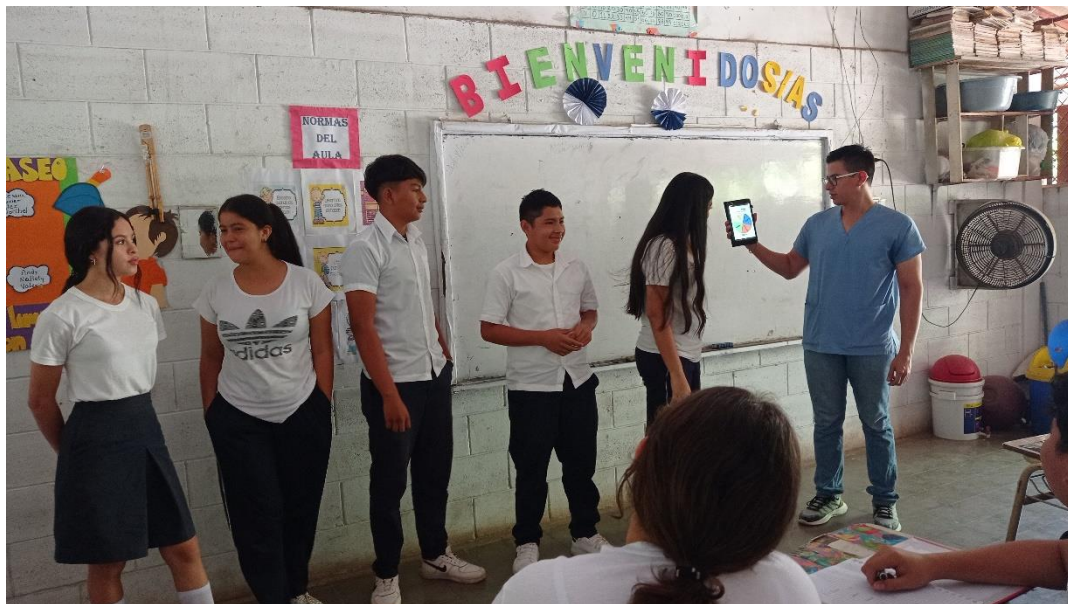
Descripción: Actividad de Rueda de las emociones