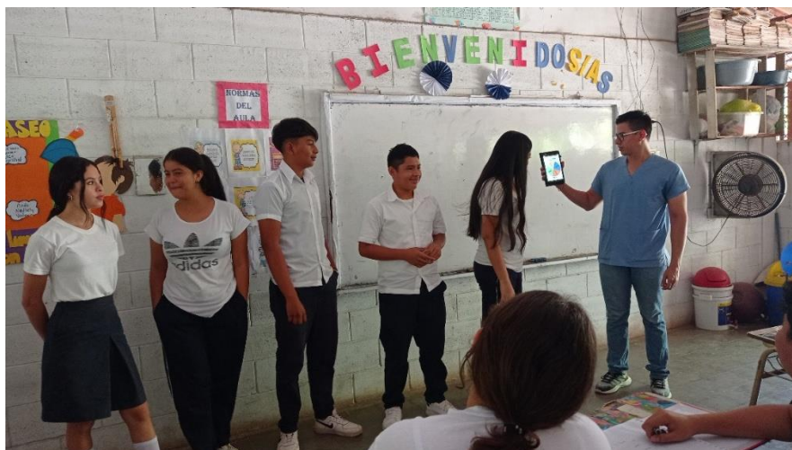
Imagen 4. Estudiantes realizando la dinámica “ruedas de las emociones”