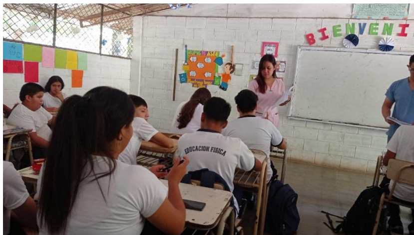
Imagen 6. Entrega de hoja para realización de actividad