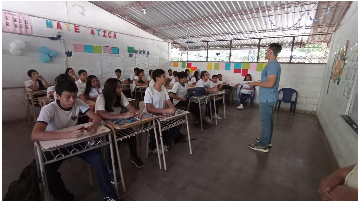
Descripción: Apertura de taller, explicación de puntos a tratar e indicaciones generales.