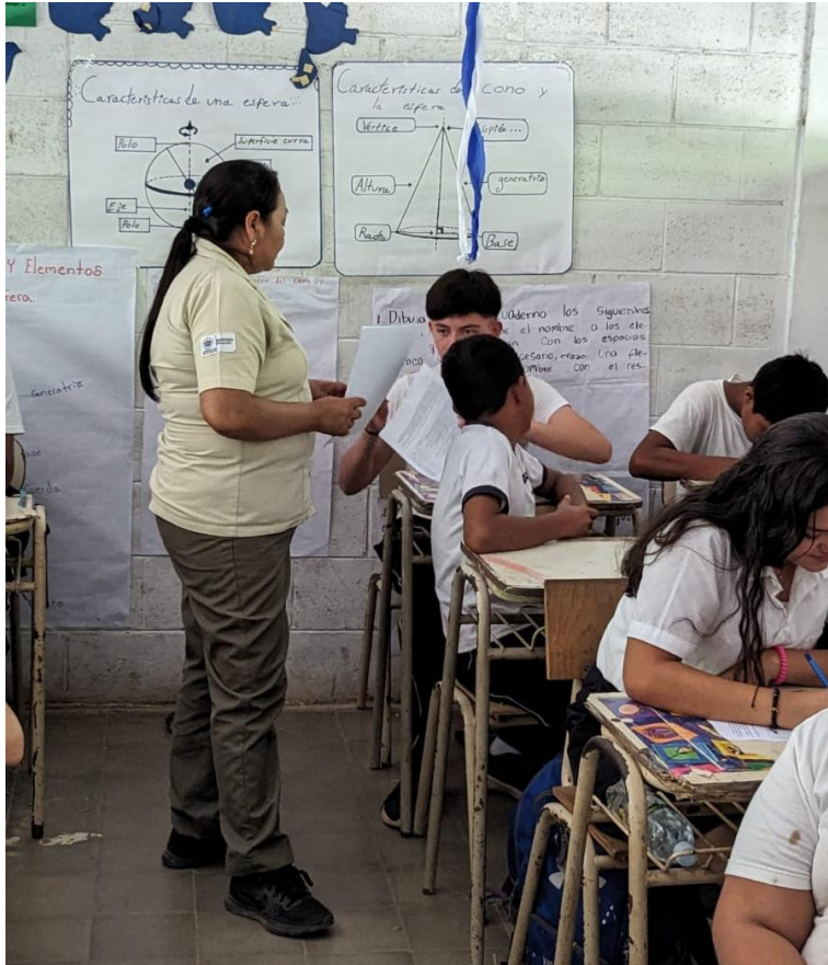
Descripción: Colaboración de promotores de salud de USI Tejutla en ejecución de proyecto.