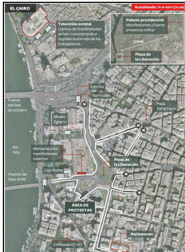
Mapa 2.1: área de manifestaciones en El Cairo y su trayectoria hasta la Plaza Tahrir