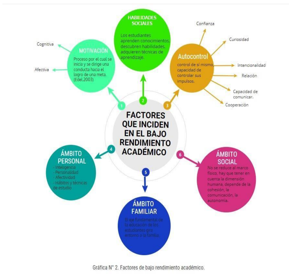
Gráfica N° 2. Factores de bajo rendimiento académico.

Por lo tanto, los miembros de la comunidad educativa en articulación garantizan un eficaz clima positivo que beneficia el contexto escolar. Por otra parte, los climas tóxicos pueden ocasionar una convivencia negativa, provocando con ello reacciones de estrés, apatía al estudio e irritación en los estudiantes, lo que genera sensaciones de desesperanza, desmotivación, desinterés en las actividades escolares. La presencia de los climas escolares anteriormente expuestos puede incidir en el rendimiento académico del estudiante, pues el ambiente escolar comprende múltiples factores que desencadenan situaciones que repercuten positiva o negativamente en el estudiante. La siguiente gráfica resume claramente los factores y variables que inciden en el bajo rendimiento académico expuestos anteriormente.