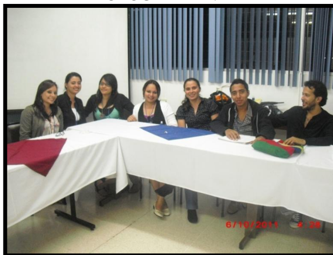
FUENTE: Fotografía tomada en el Simposio realizado en Costa Rica, 6/10/2011. Estudiantes de segundo, cuarto y quinto año académico de T.S y miembros de AETSUES.