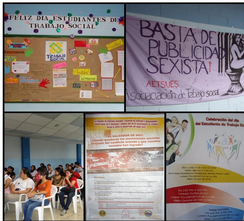
FUENTE: Fotografía tomada en la Escuela de Ciencias Sociales y diseñada por el grupo en investigación en proceso grado 2012, imagen haciendo alusión a las diferentes actividades que se llevan a cabo como AETSUES durante cada año