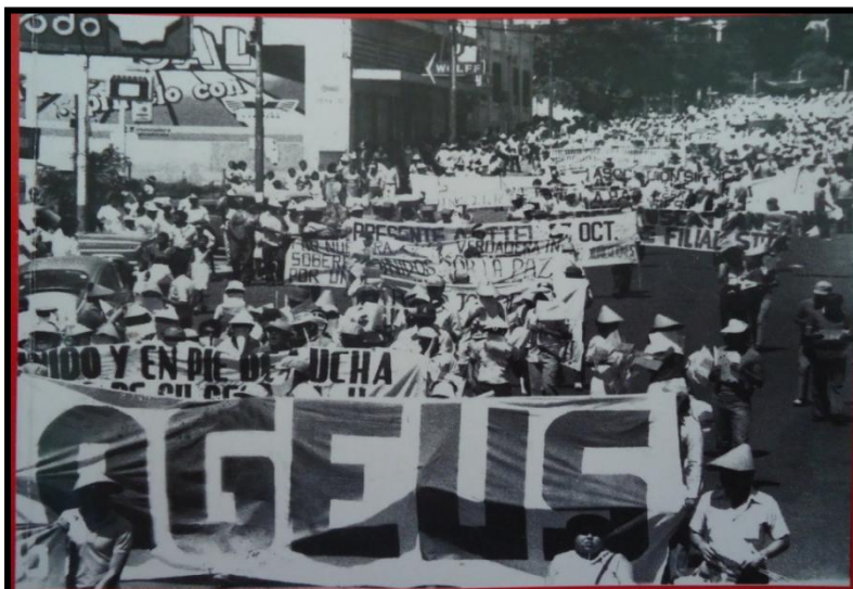
FUENTE: Imagen tomada del libro: 25 años de estudio y lucha 2008, estudiantes integrantes de AGEUS, realizando marcha.

Las asociaciones estudiantiles legales, son aquellas que han llenado ciertos requerimientos que solicita el Reglamento Interno de la UES, al legalizarse, las asociaciones tienen más posibilidad de servir como un medio adecuado para colaborar con los estudiantes, ser reconocidos por las autoridades y recibir apoyo 6 .