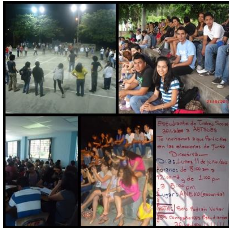
Estudiantes de Trabajo Social participando en las diferentes actividades, realizadas por AETSUES, en la UES, Fotografías tomadas y diseñadas por el equipo investigador del proceso de grado, 2012