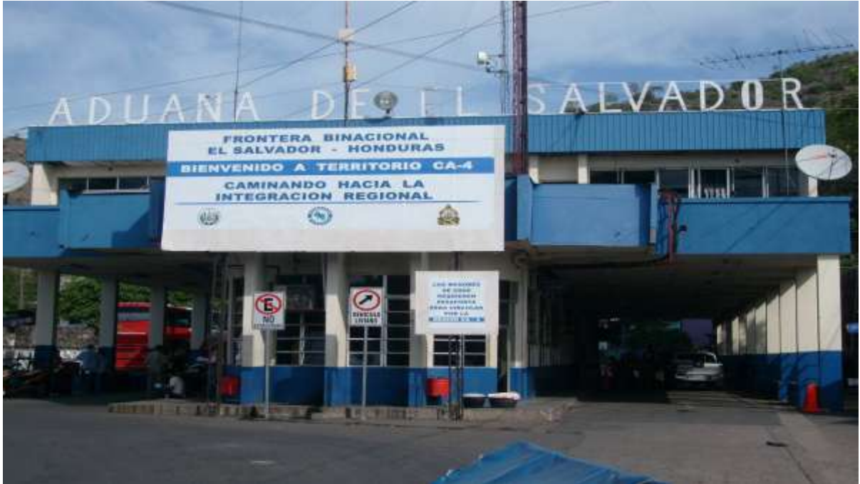
Frontera El Amatillo El Salvador-Honduras

No existe entre Nicaragua y El Salvador frontera terrestre por lo que los migrantes nicaraguenses se ven obligados pasar por territorio Hondureño ingresando por la Frontera El Guasaule y luego ingresar por la Frontera El Amatillo, cabe destacar que el flujo migratorio en esta frontera es de entre 300 y 500 nicaraguenses al día que cruzan la frontera a trabajar a El Salvador, de la cual es una mínima la que regresan.