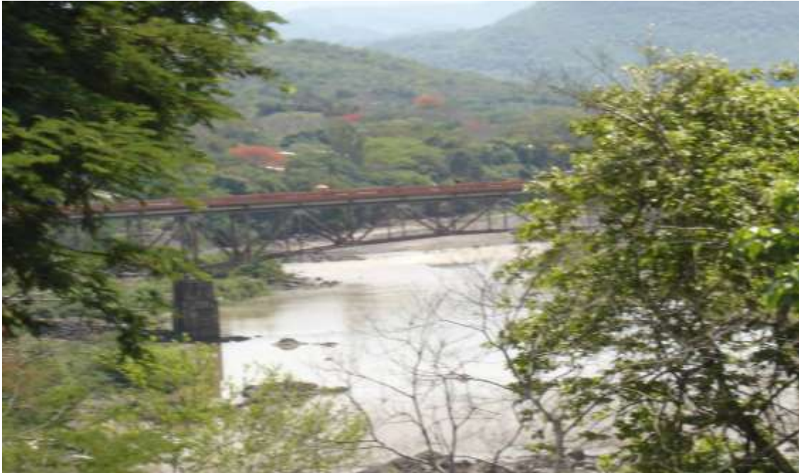
Puente entre El Salvador y Honduras