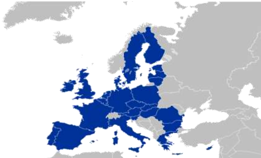
Mapa 2.2 UE -27 114

Como podemos apreciar en el siguiente mapa, conforme se ha ido ampliando el número de países miembros de la Unión Europea, se ha ampliado su territorio y con ello su poderío económico, además se ha incrementado la interdependencia y la cooperación entre los distintos Estados que la conforman, en áreas como el comercio, las inversiones, innovación y tecnología, seguridad, política exterior, políticas migratorias, entre otras.