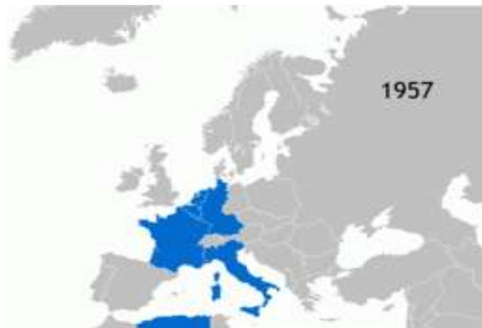
Mapa 2.1 La Unión Europea en sus orígenes 107 .

El 25 de marzo de 1957 sobre la base del Plan Schuman, se firma el Tratado de Roma y se constituye la Comunidad Económica Europea (CEE) ó Mercado Común, con el fin de que personas, bienes y servicios pudieran moverse libremente a través de toda la región. Es así que el primer paso a una unión económica y política de los países europeos siendo sus fundadores Francia, Italia, Alemania, Luxemburgo, Bélgica y Países Bajos, desembocará en esta exitosa asociación.