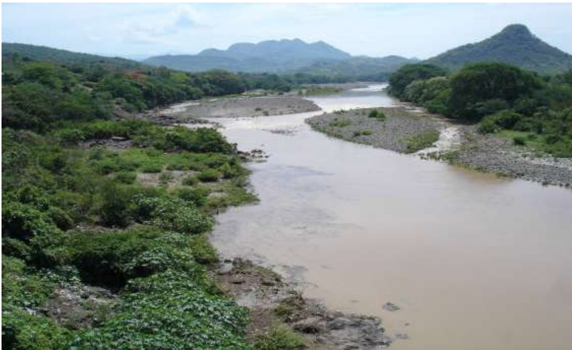
Río Goascorán, línea natural divisoria entre Honduras y El Salvador