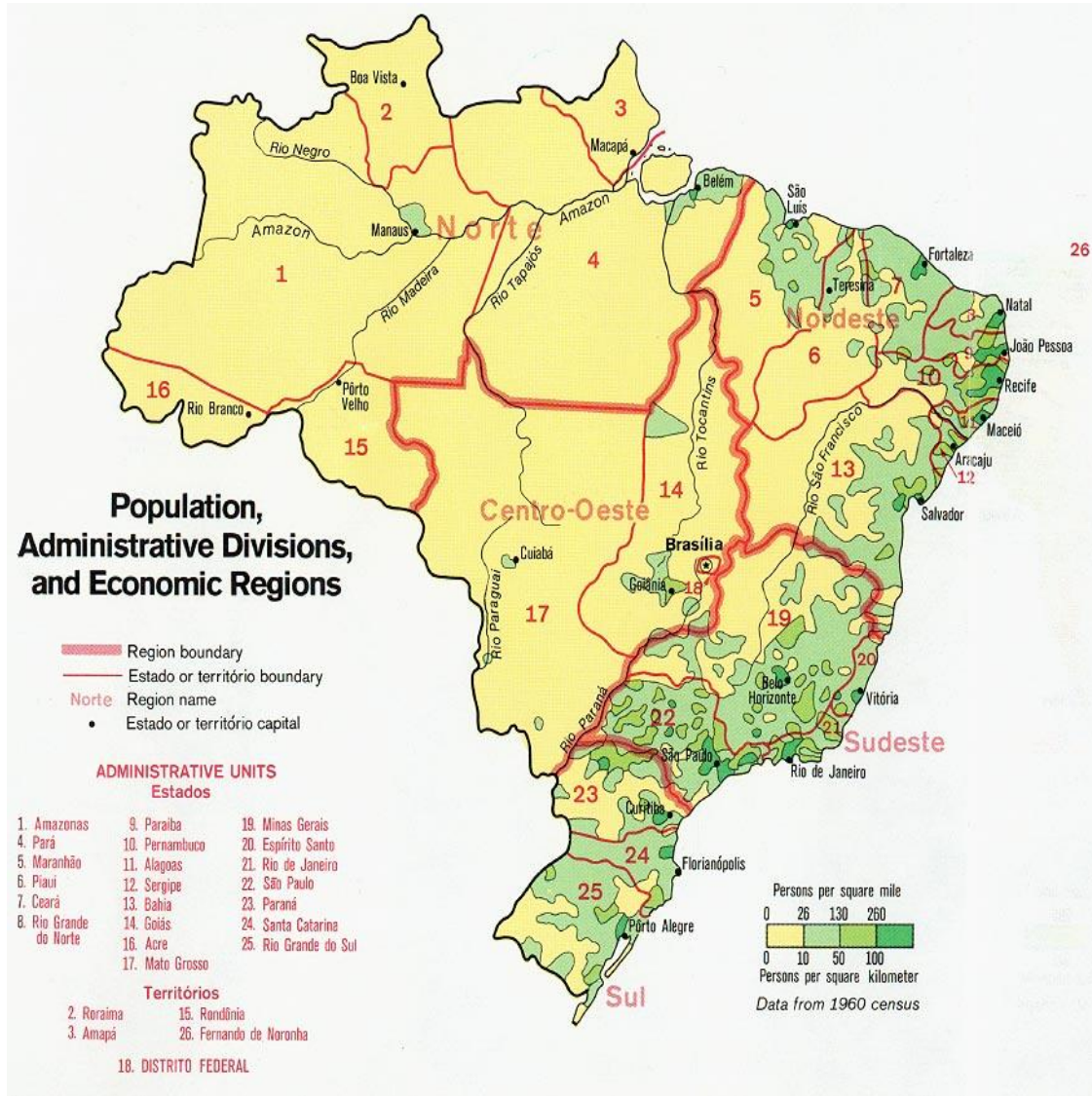
Mapa de Población, Divisiones Administrativas y Regiones Económicas de Brasil