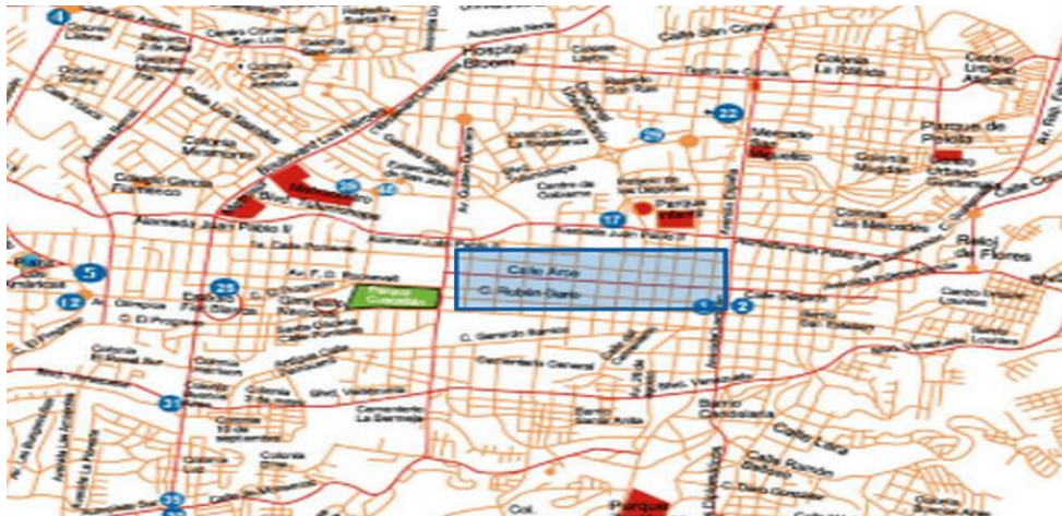
FUENTE: Alcaldía de San Salvador. Diapositivas: "Los Costos y Réditos del Ordenamiento del ordenamiento de San Salvador", presentado a la Universidad Tecnológica de El Salvador el 5/4/2013.