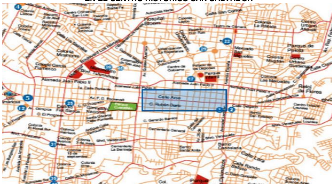
MAPA N °1. LOCALIZACIÓN DE LA ACTIVIDAD DEL COMERCIO INFORMAL EN EL CENTRO HISTORICO SAN SALVADOR