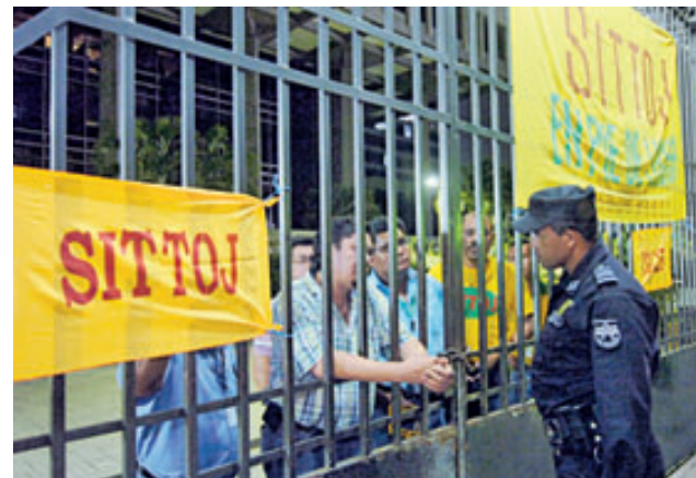
Miembros de Sittoj comunican a un policía que la toma del edificio concluirá mañana.