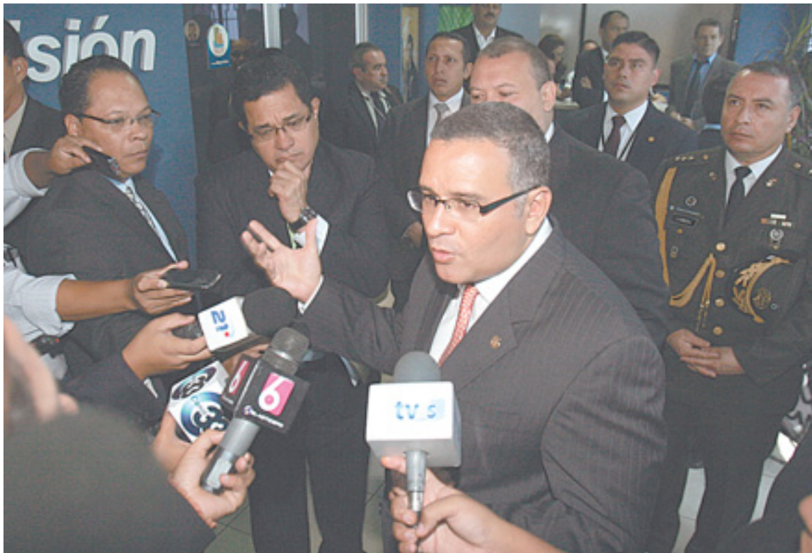
Entendimientos. El presidente Mauricio Funes anunció ayer un acercamiento con las fracciones legislativas de los partidos políticos de derecha para desarrollar sus planes económicos en los dos años que faltan para que finalice su administración.