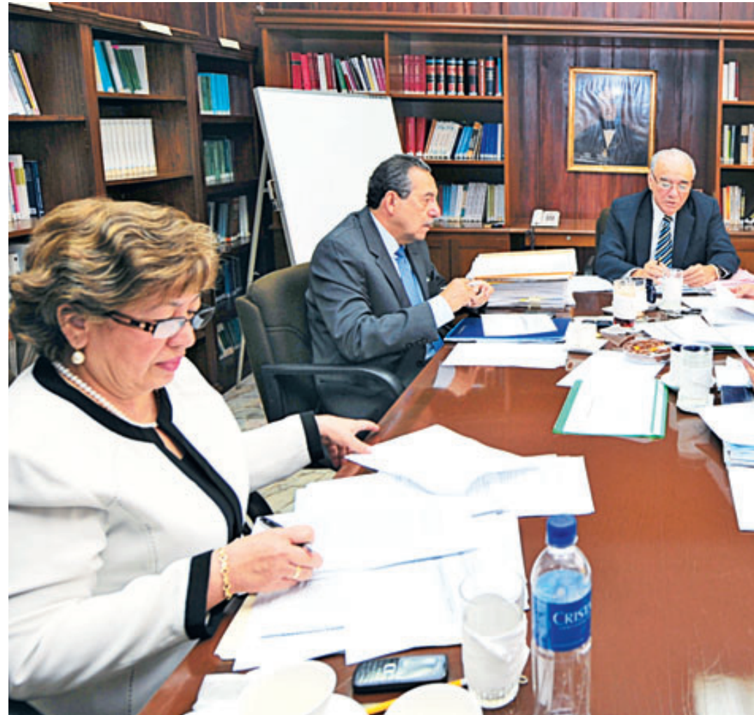
La Sala de lo Constitucional, cuatro magistrados propietarios y una magistrada suplente, en sesión ordinaria de ayer, discutieron cuestiones de trámites de demandas.