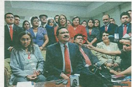
La dirigencia del FMLN dijo respaldar "totalmente" el informe de tres años de gobierno de Funes.