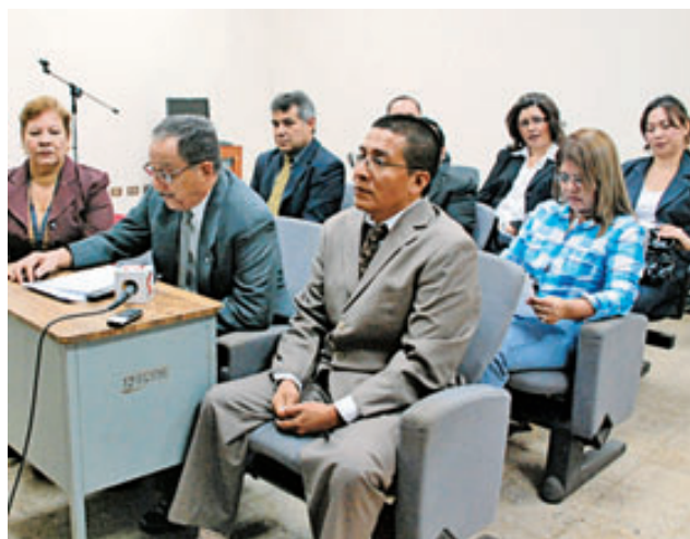
Jueces de San Miguel externaron apoyo a los magistrados y rechazo a la actitud de los diputados. EDH/LUCINDA QUINTANILLA

Katlen Urquilla Edmee Velásquez Jaime López Lucinda Quintanilla politica@eldiariodehoy.com