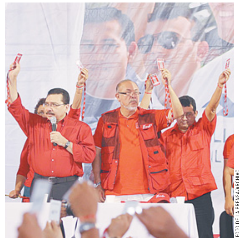
Sin expectativas. El FMLN ya descartó cualquier posibilidad de que Funes se convierta en un aliado para buscar acuerdos con países de izquierda en el Sur.

“El FMLN está presto a recibir las nuevas iniciativas que el Gobierno pueda presentar a la Asamblea Legislativa para analizarlas, estudiarlas y aprobarlas si estas benefician al pueblo salvadoreño o imprimirles las modificaciones que fueran necesarias”, detalló.