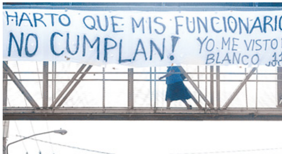
Campaña. Para esta semana se preparan campañas, marchas, concentraciones y conversatorios en pro de la Sala de lo Constitucional de la Corte Suprema de Justicia, ante un eventual fallo de la CCJ.

Mientras tanto, el movimiento cívico ciudadano Por Un Mejor El Salvador (PORMESAL) presentará hoy su “plan de organización e invitación abierta para la multitudinaria marcha y concentración ciudadana” que se llevará a cabo el jueves. “La concentración esperará a más de 40,000 ciu-