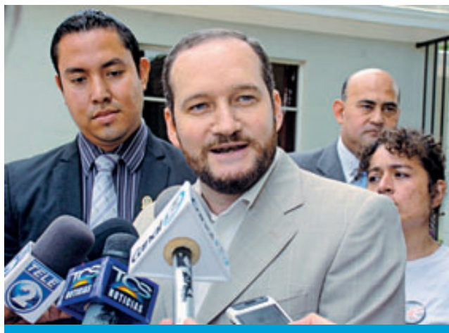
Aliados por la Democracia llegaron ayer a la Casa Presidencial.