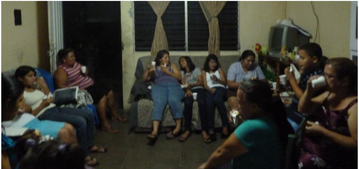
Fuente: fotografía captada por la estudiante Magdalena Aldana, durante taller con mujeres obreras de Taller Confecciones “Albert”, sábado 20 de julio 2013.