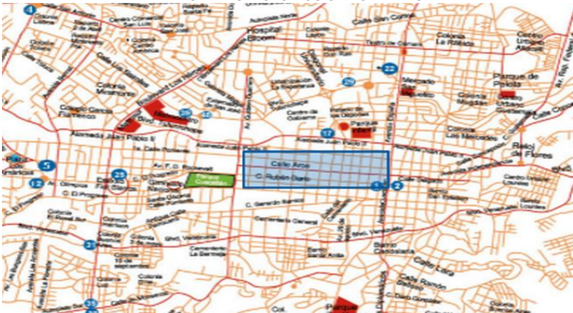
MAPA N °1. LOCALIZACIÓN DE LA ACTIVIDAD DEL COMERCIO INFORMAL EN EL CENTRO HISTORICO SAN SALVADOR