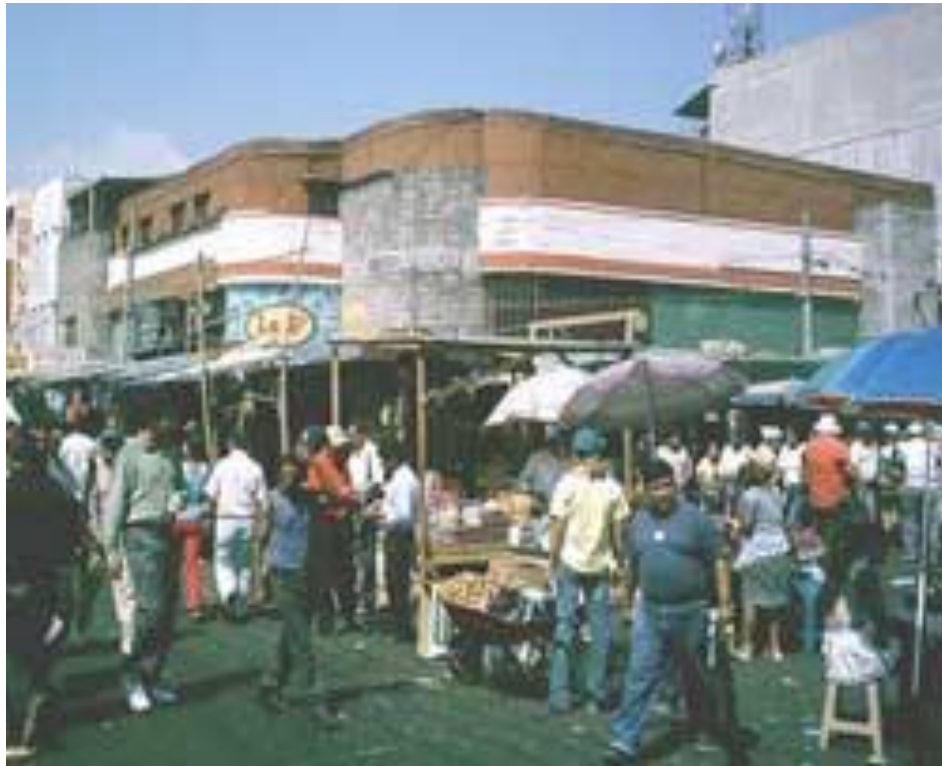
Vista del centro de San Salvador colmado de vendedores y peatones, Junio 16, 2005.