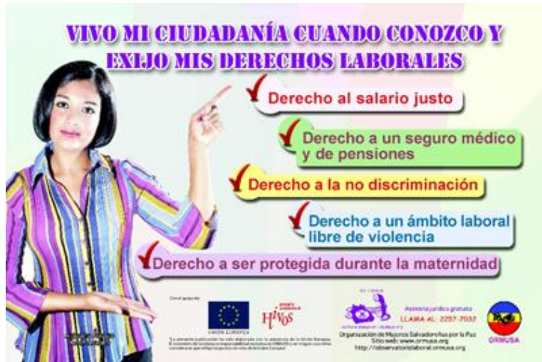
Figura 4. Muestra de Campaña utilizando TIC (Derechos Laborales)