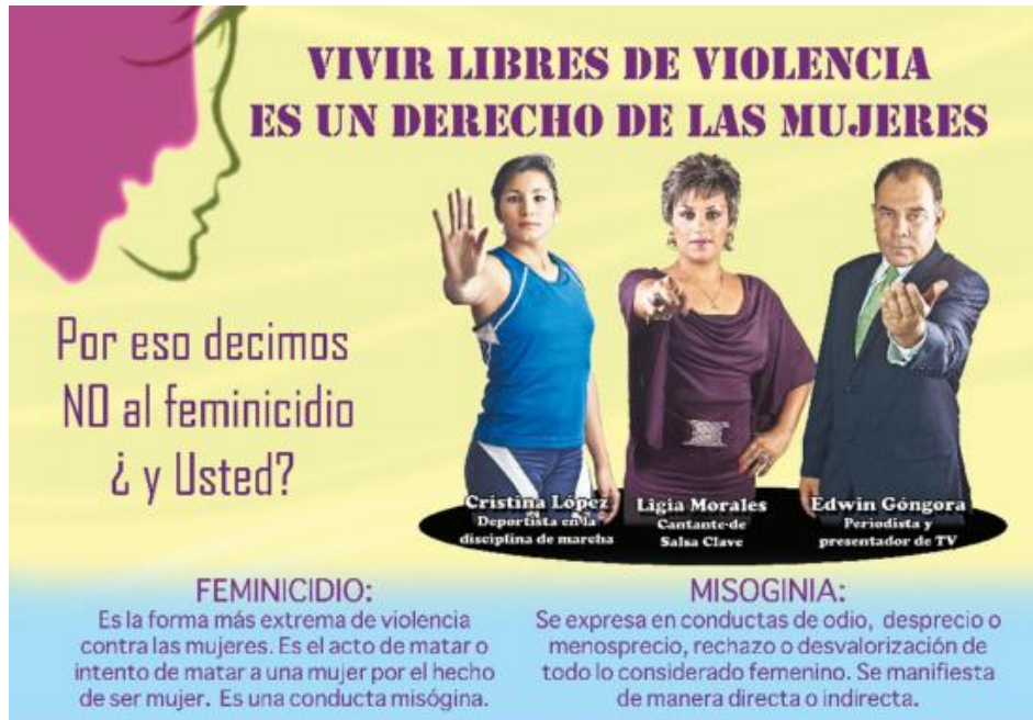
Figura 1. Muestra de Campañas utilizando TIC

Campaña 2009, impulsada por ORMUSA en medios de comunicación y alternativos, entre ellos banners móvil y estacionarios, folletos informativos y cuadernos educativos, afiches calendarios, bolsos y lapiceros entre otros.