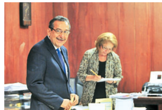
El magistrado presidente, Florentín Meléndez, brindó declaraciones tras de salir de la Corte Plena.

“Le dije que estamos desprotegidos y que los policías que estaban en los alrededores no brindaron ninguna protección. Tenemos temor de que en las próximas horas