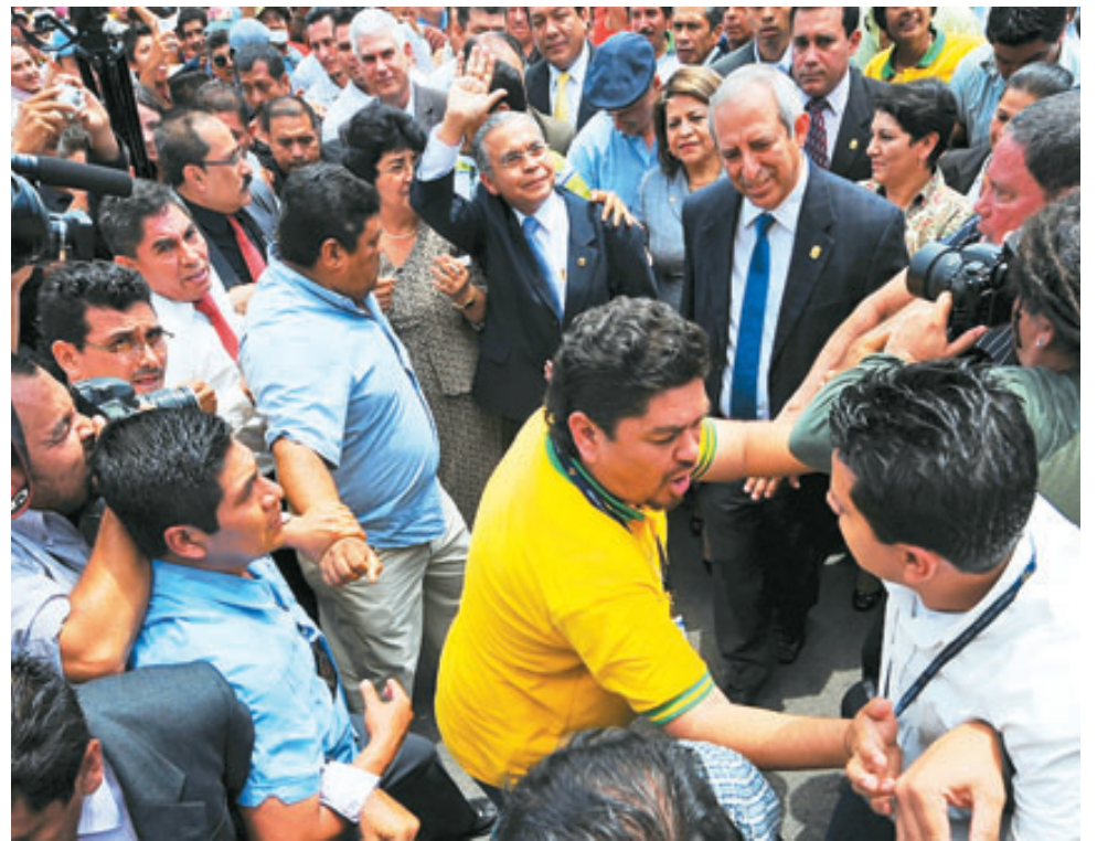
ARENA dice que no reconoce al nuevo presidente de la CSJ.