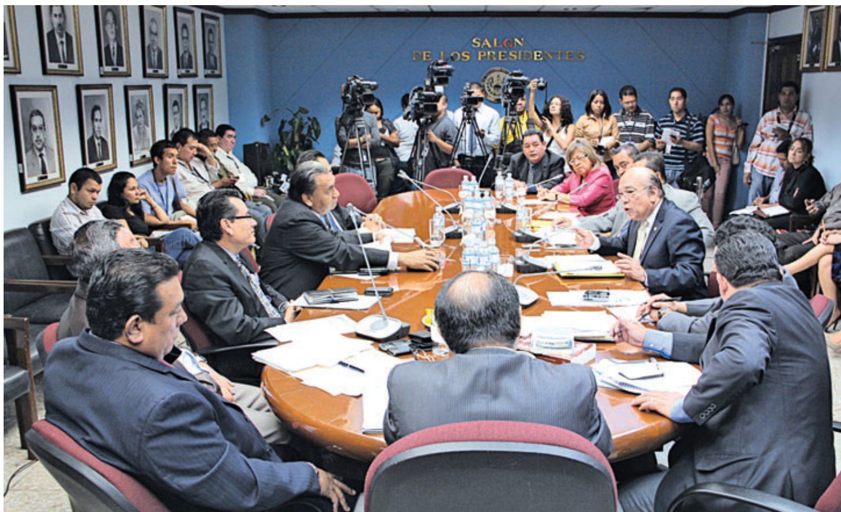
El pleito ha derivado en una investigación de la Asamblea sobre la elección de los magistrados Jaime y González. Ayer oyeron al CNJ.

La gremial hace un llamado al organismo regional a que