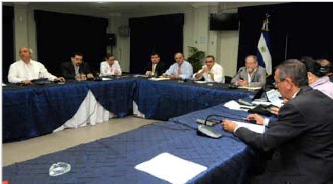
El Presidente de la República, Mauricio Funes, durante la reunión en Casa Presidencial con los dirigentes de los partidos políticos, donde presentaron sus propuestas de magistrados propietarios y suplentes para conformar la Corte Suprema de Justicia.

Asimismo, el mandatario dijo que han adoptado como metodología de trabajo, en un primer momento definir la Corte Plena que componen los 15 magistrados, y que los partidos políticos tendrán que ponerse de