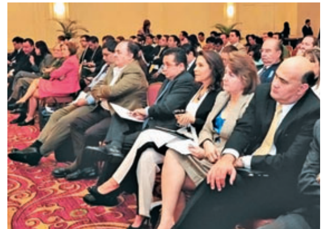
Aliados por la Democracia aplaudieron las decisiones de la Sala de lo Constitucional.

Agregó que la Asamblea tiene un mes para la elección y todas las entrevistas que hagan a los candidatos deben ser accesibles al público para que