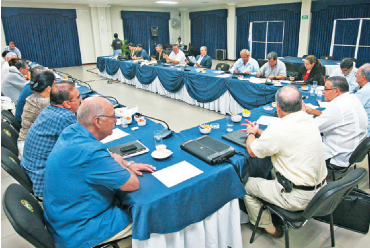
Los acuerdos a los que llevó la mesa de diálogo serán materializados hoy en una sesión plenaria especial.