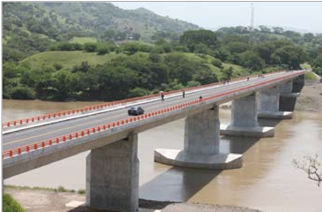
El tercer puente más largo del país que une los municipios de Ciudad Dolores, en Cabañas, y Nuevo Edén de San Juan, en San Miguel, y que fue construido con una inversión de 17 millones de dólares provenientes de FOMILENIO, fue inaugurado ayer.

Asimismo, el Presidente Funes hizo hincapié sobre el desarrollo económico que traerá esta infraestructura ya finalizada; ya que antes los lugareños tenían que desplazarse por balsas y “ferri” las producciones agrícolas y lácteos, que son de