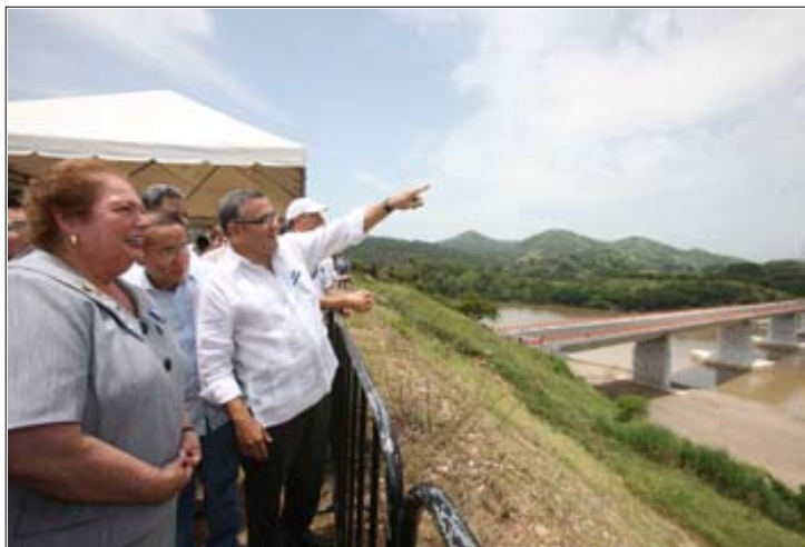
El Presidente de la República, Mauricio Funes, muestra el paisaje, ayer, a la Embajadora de los Estados Unidos Mari Carmen Aponte.

“Veníamos de una tasa de catorce homicidios por día y que luego después de unas semanas se ha reducido a cinco homicidios por día, si de pronto hay un día que en lugar de cinco o seis tiene siete, es parte del accionar de la delincuencia. Lo importante es que seguimos con un nivel bajo de homicidios”, indicó el mandatario.