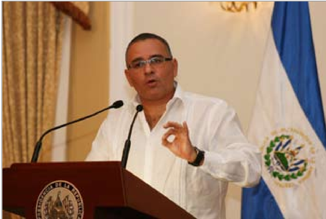
Presidente de la República, Mauricio Funes, brinda conferencia de prensa, tras la segunda reunión de más de 8 horas con representantes de partidos políticos.

En esta segunda reunión, al igual que la primera, participaron los dirigentes políticos con representación en la Asamblea Legislativa. En esta reunión se aplicaron métodos de resolución de conflictos sugeridos por las Naciones Unidas. “Hemos logrado consensos que nos permiten hablar de acuerdos parciales, que siguiendo el método que resultó exitoso durante el proceso de negociación entre el gobierno y el FMLN; y que dio como resultado los Acuerdos de Paz de 1992, estamos siguiendo el método que sugirió Naciones Unidas. Y es de que cuando se logra consenso sobre aspectos parciales se meten en un congelador en espera de lograr un acuerdo de carácter integral, de tal manera que esos consensos parciales que se han metido en el congelador puedan cobrar plena