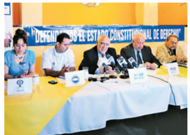
Miembros de Cree dijeron estar pendientes de la discusi n sobre el conflicto en la Asamblea.

Es por esa decisi n de los diputados de dialogar que Cree acord  dar un comp s de espera para esperar resultados, de lo contrario, continuar n con su decisi n de demandar a los