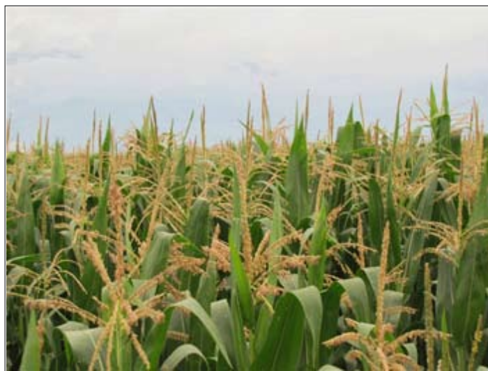
La Asociaci n de Proveedores Agr colas (APA) impulsa el cultivo de ma z con semillas transg nicas.

La APA asegura que entre los beneficios de los cultivos transg nicos est  la mayor producci n de granos, la resistencia a la sequ a y el dejar de usar pesticidas qu micos.