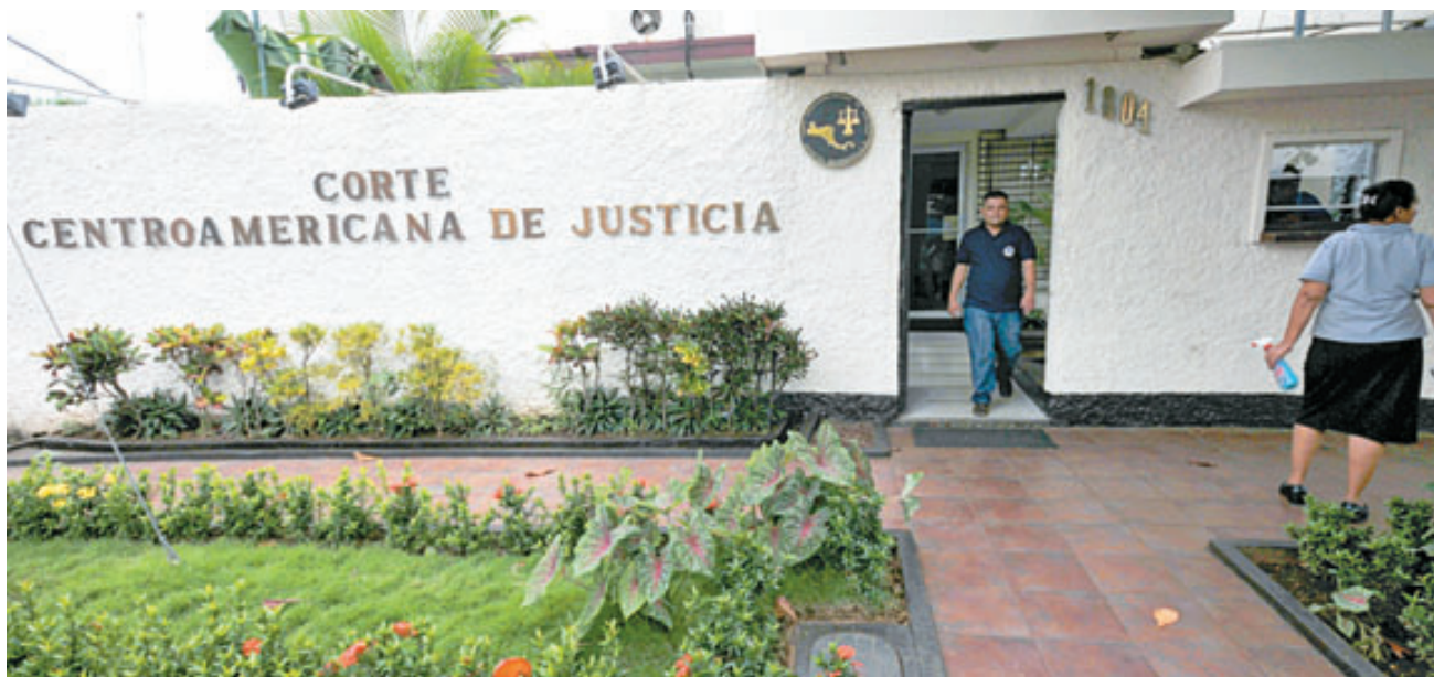
Aliados por la Democracia demandaron ante la Fiscalía a los magistrados de la CCJ.

Los firmantes del campo pagado aseguran que el juzgador es blanco de “injustificados ataques personales” por defender la Constitución.