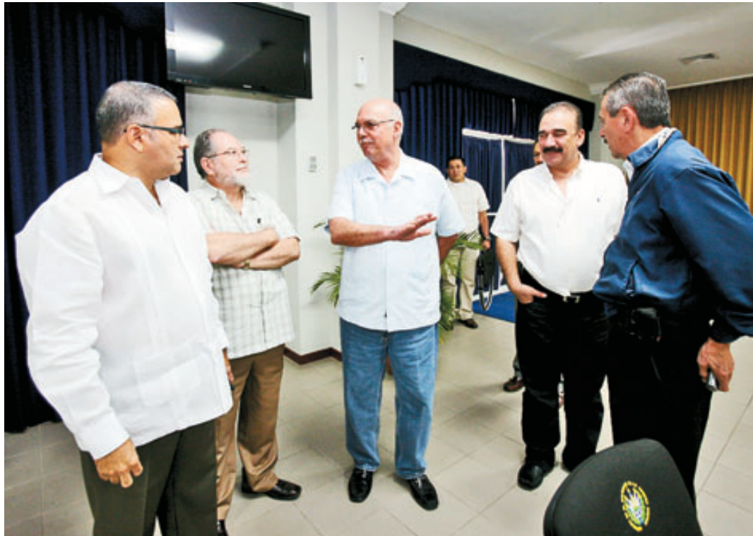
La mesa de diálogo continuará tras el receso agostino, el martes 7 a las tres de la tarde.

Este es el acuerdo al que llegaron los partidos, tras siete jornadas de negociaciones en Capres.