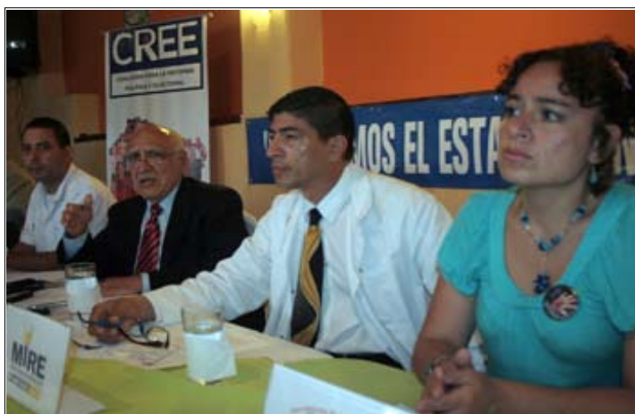
La organización Reforma Política y Electoral (CREE) y la Iniciativa Social para la Democracia (ISD), proponen reformas al sistema político-electoral.

CREE considera que el TSE necesita separarse de todo vínculo político y debe de estar conformado por magistrados no partidarios. “Eliminar el monopolio de los partidos políticos, como intermediarios y administradores. Despartidarizar la justicia electoral separando las funciones adminis-