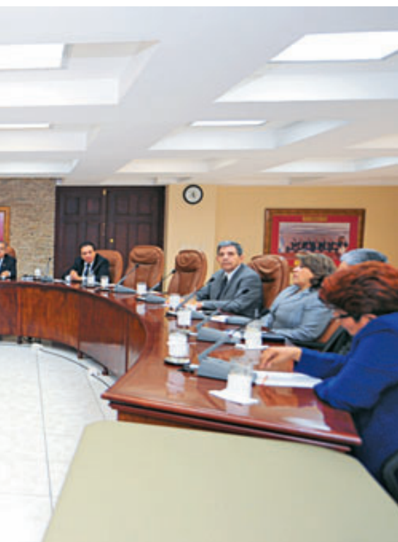
Los magistrados de 2006 y 2012 realizaron una sesión de Corte Plena después de que un cerrajero abriera la puerta del salón. Acordaron la distribución de magistrados para las salas.