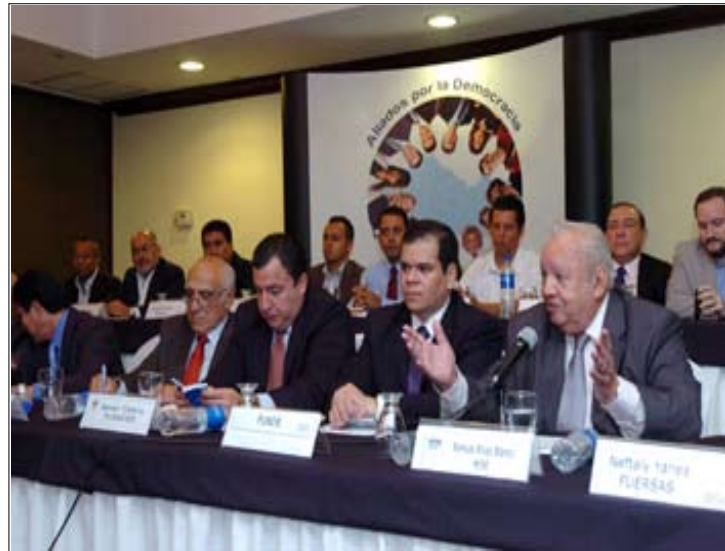
Movimiento Aliados de la Democracia.