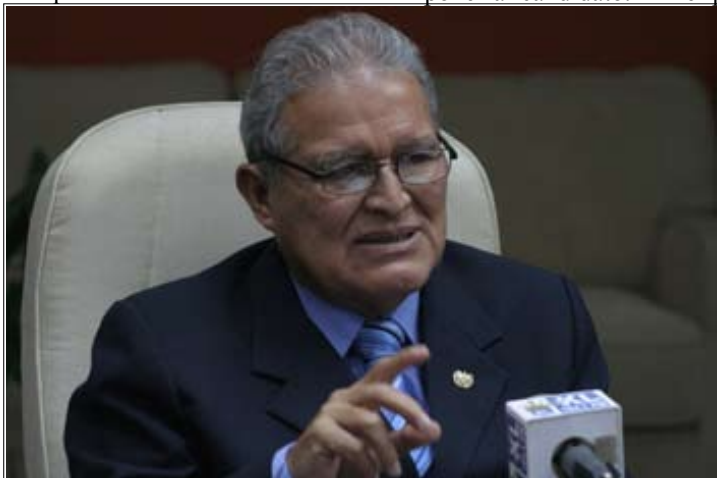
Vicepresidente de la República, Ministro de Educación Ad Honorem y presidente del Consejo Nacional de la Niñez y de la Adolescencia (CONNA), Salvador Sánchez Cerén.

Salvador Sánchez Cerén, Vicepresidente de la República y Ministro de Educación, desmintió que sea el candidato oficial