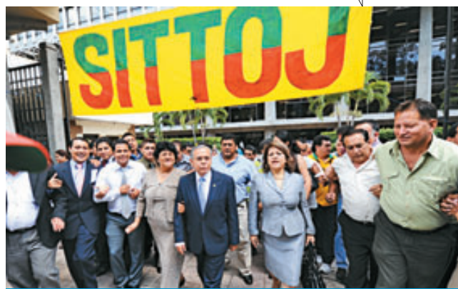
Ovidio Bonilla salió en compañía de otros magistrados para saludar a los empleados.

Ovidio Bonilla: “Fue necesario usar a un cerrajero después de que agotáramos todos los esfuerzos para que nos entregaran las llaves de la oficina de la presidencia. No es un acto vandálico, estamos en el legítimo derecho que la Asamblea Legislativa nos dio”