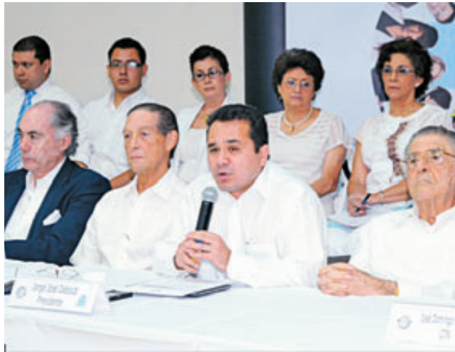
Los Aliados por la Democracia se mostraron preocupados por los hechos acaecidos ayer en la CSJ.