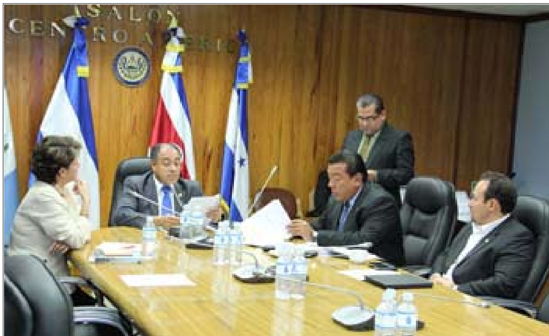
La Comisión Especial que investiga la ilegalidad en la elección de Magistrados de la Corte Suprema de Justicia (CSJ), en julio de 2009, analiza consecuencias de la “usurpación” de la Presidencia del órgano judicial.

Para los legisladores, luego del análisis del caso sobre la elección de la generación 2009, la legalidad de dichos magistrados es nula, puesto que la Asamblea Legislativa de aquel entonces eligió sin respetar la medida cautelar de la Sala de lo Constitucio-