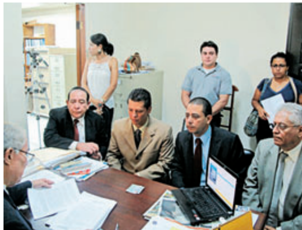
Miembros de CREE y del ISD llegaron ayer a la sede de la CCJ a interponer una denuncia en contra de la Asamblea.

Artículo 22. La competencia de la Corte será... “literal f) Conocer y resolver a solicitud del agraviado de conflictos que puedan surgir entre los Poderes u Órganos fundamentales de los Estados, y cuando de hecho no se respeten los fallos judiciales;...”. En esto se basan CREE y el ISD para pedirle a la CCJ que se declare “incompetente” en el caso de la Asamblea-CSJ.