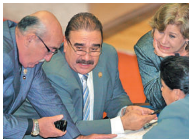
La bancada tricolor ha pedido al FMLN que haya diálogo, pero dicen que no han recibido respuesta.

yshondt, director de Información de ARENA, criticó que el presidente legislativo haya hablado de “democracia participativa, cuando en este país tenemos una democracia representativa”.