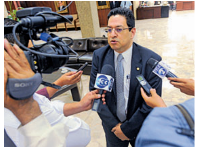
El FMLN pidió ayer a la Asamblea Legislativa la destitución del magistrado González.

En todo caso, le parece que la denuncia de Aliados por la Democracia forma parte más bien de “un juego político, en el que nosotros no participamos, porque lo nuestro es la parte jurídica de este caso, y es ahí donde nos vamos a mantener”, prometió.