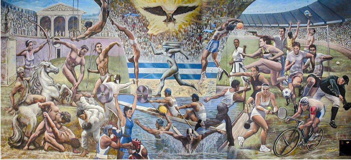
Mural: “Visión Olímpicas de las Civilizaciones”