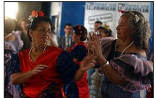
Muchas veces, los adultos mayores son abandonados por sus hijos cuando están entre los 60 y los 70 años o en otros casos están solos y desamparados, y no tienen a nadie que los cuide ni los atienda.

El abandono en el que viven los ancianos para muchos es injusto, ya que después de