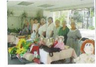
Exposición de manualidades

Dentro de su naturaleza, está la de ofrecer una gama de actividades en las áreas: Recreativa, Motivacional, Ocupacional y Cultural, de tal manera de provocar el interés, iniciativa e integración.