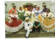
Grupo de Danza Folklórica