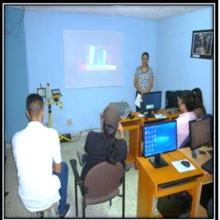
Grupo Focal 4. (10/6/2015) Lab. De fotografía del departamento de periodismo de la UES. estudiante dando su perspectiva de la calidad informativa presentada en la muestra.