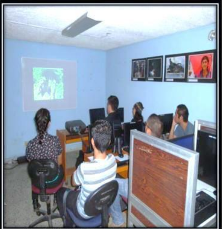
Grupo Focal 2. (9/6/2015) Lab. De fotografía del departamento de periodismo de la UES. Exposición de la muestra: Los estudiantes observan la muestra audiovisual.