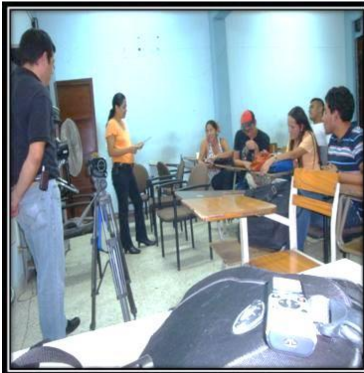
Grupo Focal 1. (25/5/2015) Aula 31 del departamento de periodismo de la UES. Trabajo con el grupo de estudiantes, Camarógrafo Iván Bonilla, Conducción Betty Soriano.