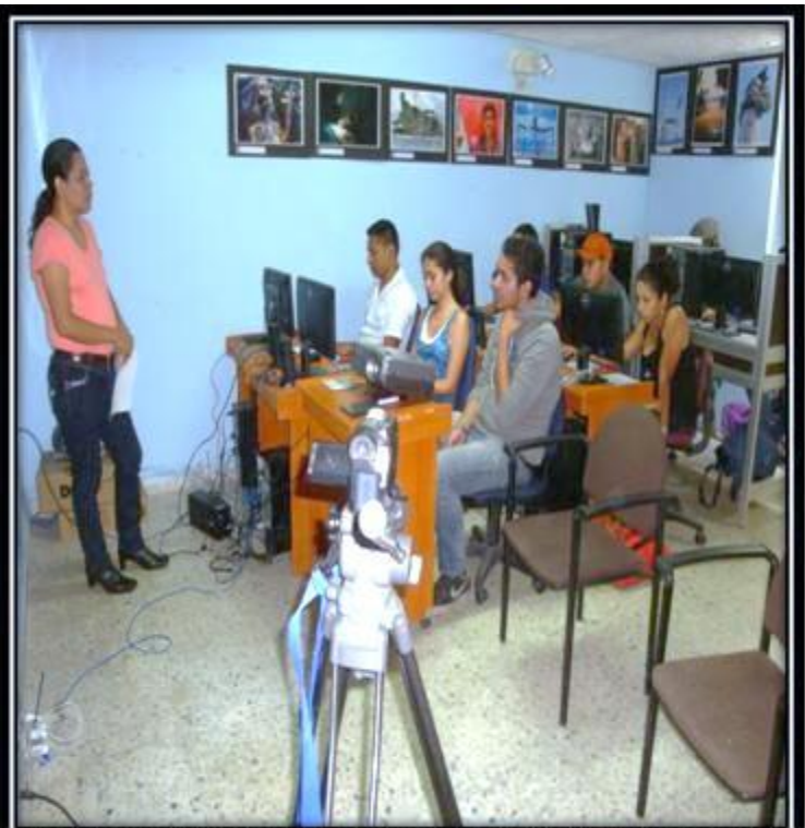
Grupo Focal 3. (9/6/2015) Lab. De fotografía del departamento de periodismo de la UES. Discusión: Sobre la muestra audiovisual presentada.