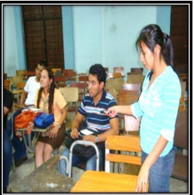
Grupo Focal 1. (25/5/2015) Aula 31 del departamento de periodismo de la UES. Trabajo con el grupo de estudiantes, Grabación, apuntes y asistencia técnica: Laritza Cruz.