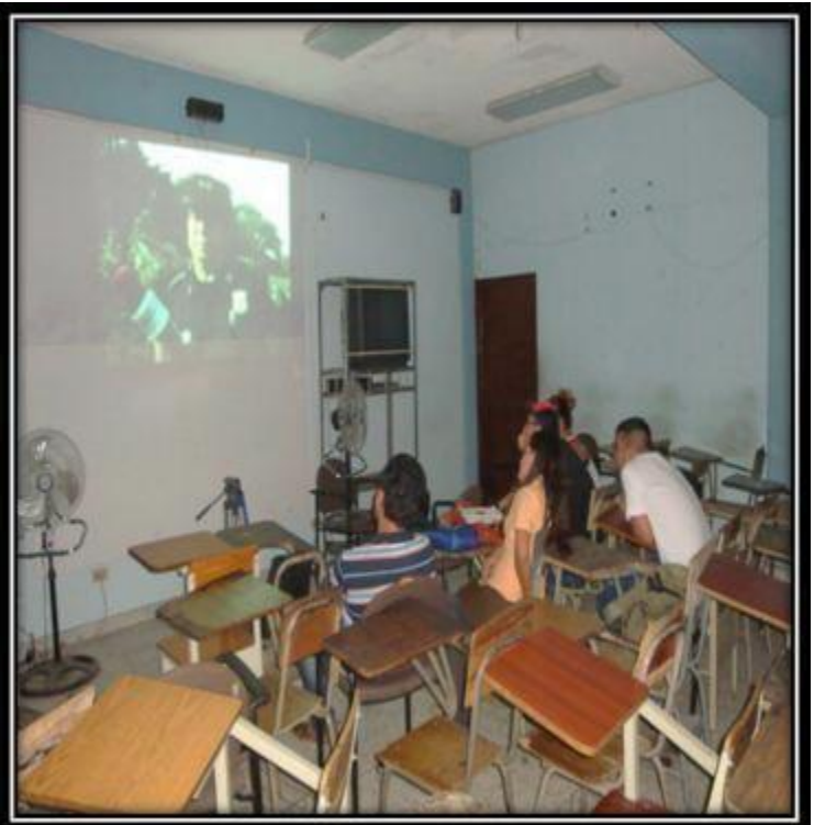
Grupo Focal 1. (25/5/2015) Exposición de la muestra: Los estudiantes observan la muestra audiovisual.