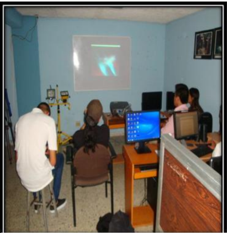
Grupo Focal 4. (10/6/2015) Lab. De fotografía del departamento de periodismo de la UES. Exposición de la muestra: Estudiantes observan la muestra audiovisual presentada.