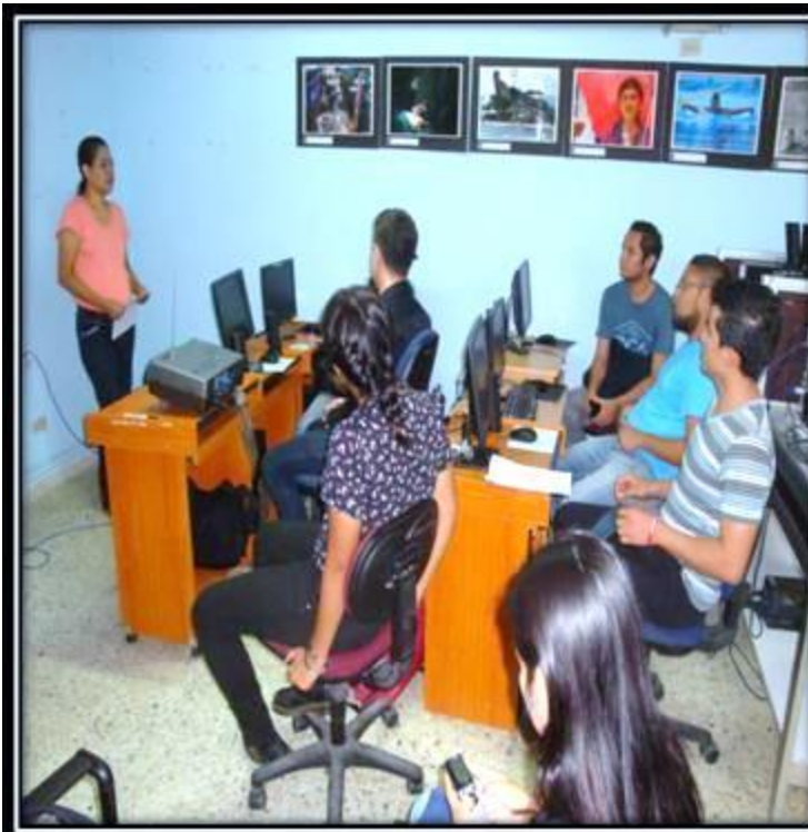
Grupo Focal 2. (9/6/2015) Lab. De fotografía del departamento de periodismo de la UES. Trabajando con el grupo de estudiantes de quinto año de periodismo.