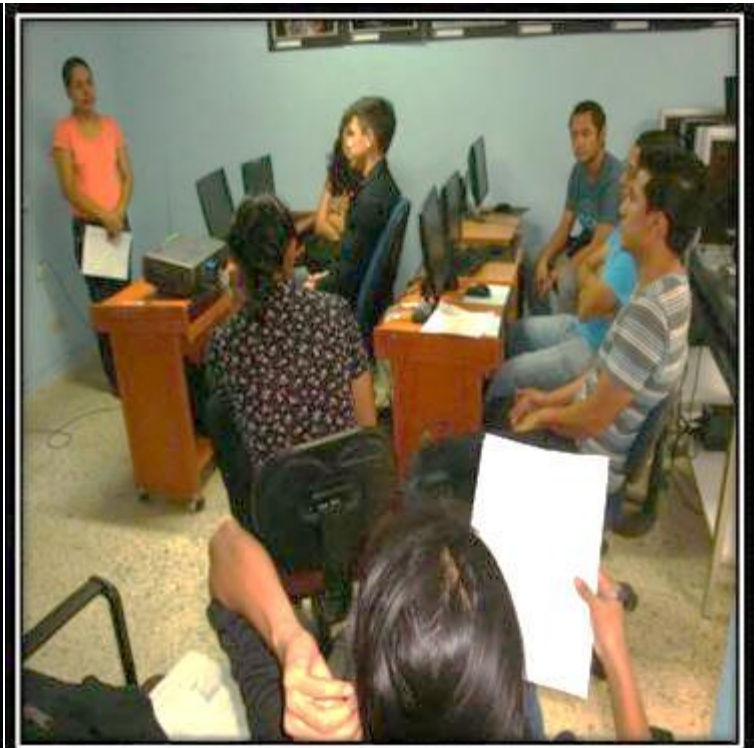
Grupo Focal 2. (9/6/2015) Lab. De fotografía del departamento de periodismo de la UES. Trabajando con el grupo de estudiantes a punto de presentarles las noticias de muestra.