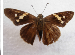
Epargyreus spp *