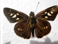
Drephalis spp *