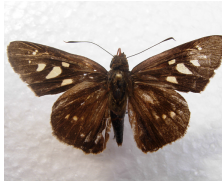
Drephalis oria *