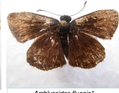
Amblyscirtes fluonia *