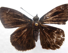
Nisoniades laurentina *