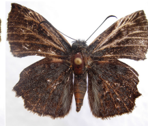
Bolla imbras *